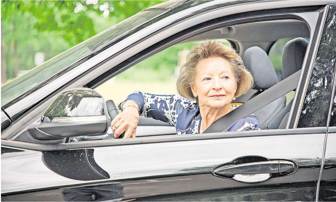
DAS PROGRAMM „SICHER MOBIL“ soll älteren Menschen Mut machen, sich im Straßenverkehr souverän zu bewegen.

Das Programm richtet sich an ältere Menschen ab 65 Jahren, die aktiv am Straßenverkehr teilnehmen. Ganz gleich, ob sie mit dem Auto, dem Fahrrad, Pedelec oder zu Fuß unterwegs sind. Ziel ist es, die Mobilität im