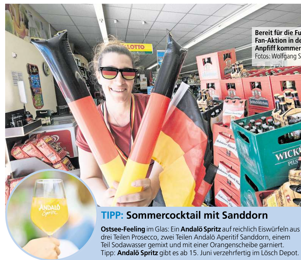
Bereit für die Fußball-Weltmeisterschaft: Mit der Fan-Aktion in den Lösch-Depot-Filialen kann der Anpfiff kommen.

Eine Verlockung für Fußballfreunde ist die Kronkorken-Aktion von Bitburger, Partner der deutschen Nationalmannschaft. Als Hauptgewinne winken insgesamt 17 Fußballreisen für zwei Personen mit dem offiziellen DFB-Trikot sowie zahlreiche attraktive Direktgewinne. Der Weg dahin? Bitburger Aktionsflaschen öffnen, QR-Code scannen oder Länderflaggen