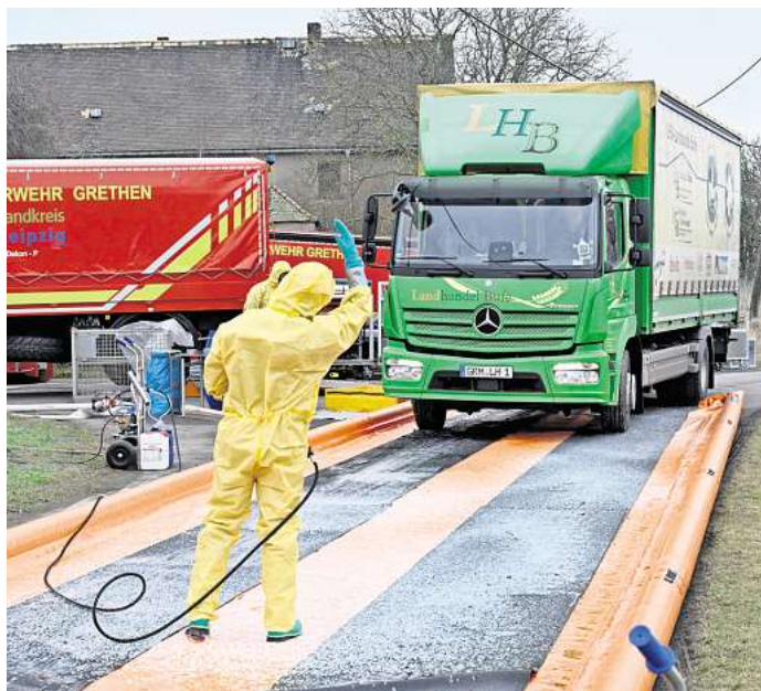
Die Geflügelpest grassierte Ende des vorigen Jahres im Landkreis Leipzig. Die Zahl der Ausbrüche bei Hausgeflügel und Wildvögeln ist inzwischen aber stark zurückgegangen.

Inzwischen hat sich die Lage grundsätzlich deutlich beruhigt. Die Zahl der Ausbrüche bei Hausgeflügel und Wildvögeln ist stark zurückgegangen. In Sachsen, Sachsen-Anhalt und Thüringen wurden seit vier Wochen keine neuen Fälle gemeldet. Das Friedrich-Löffler-Institut erwartet, dass sich dieser Trend im laufenden Monat Mai fortsetzt,