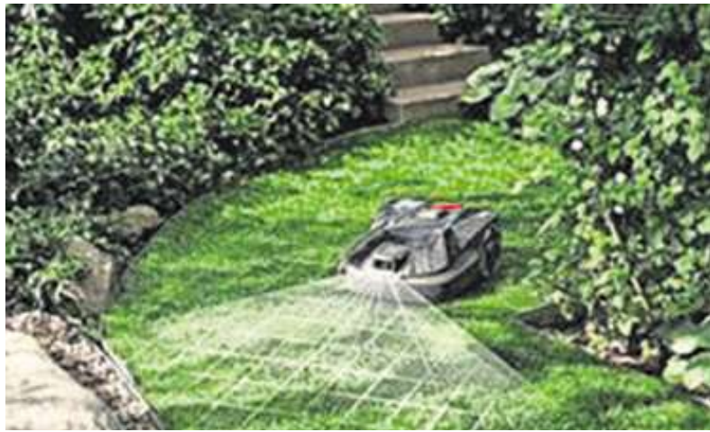
Eine neue Mähroboter-Generation ist jetzt bei Achilles in Fuchshain im Angebot.

Die KI-gestützte Erkennungstechnologie ist in unseren neuesten kabellosen Modellen integriert und macht die Rasenpflege intelligenter denn je. Ob für kleine oder große Rasenflächen oder Gärten mit hügeligem Gelände – es gibt ein Modell, das perfekt auf Ihre Anforderungen abgestimmt ist*, wirbt der Hersteller.