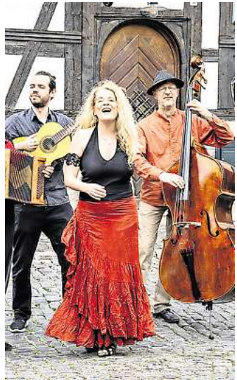
„The String Company“ spielt am 17. Mai in der Kirche zu Panitzsch.

BORSODORF. Die Band „The String Company“ spielt am 17. Mai ab 17 Uhr ein Kirchenkonzert in der Kirche zu Panitzsch. Die jüdische Musiktradition ist im Ensemble durch den Bratschisten Lev Guzman unmittel-