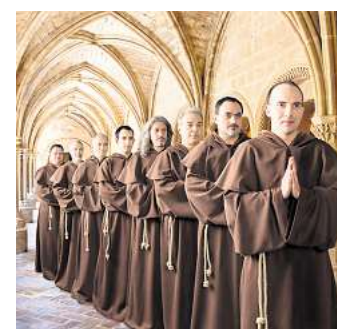
„The Gregorian Voices“ singen am 15. Mai in Grimma.

Seit dem Frühjahr 2011 ist die Gruppe auf Tournee in Europa. Unter der künstlerischen Leitung von Oleksij Semenchuk präsentieren die acht außergewöhnlichen ukrainischen Solisten die musikalische Tradition der Gre-