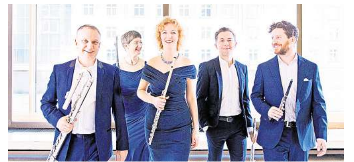
Das Leipziger Querflötenensemble „Quintessenz“ spielt am 14. Mai in Höfgen.

Unter dem augenzwinkernden Titel „Ich liebe keine Blasmusik“ steht das diesjährige Programm ganz im Zeichen Robert Gernhardts (1937 bis 2006), der als einer der bedeutendsten deutschen Lyriker und Satiriker gilt. Auf Grund seiner Ironie und großen stilistischen Vielfalt prägte er die deutschsprachige Literatur und ist bis heute fest in den Herzen vieler Literaturfreunde fest verankert. Auf den idyllischen Pfaden durch die Höfge-