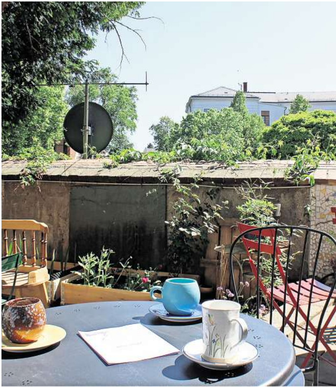
Das Gartencafé am Domplatz in Wurzen hat wieder dienstags und mittwochs geöffnet.

„Während es dienstags im Gartencafé keine Angebote geben wird, gibt es dagegen mittwochs immer ein kleines und vielfältiges Programm, wie etwa Kunstnachmittage für Kinder, ein Lass-uns-gemeinsam-singen-Café und ein Bingoevent für Senior:innen geben und ein-