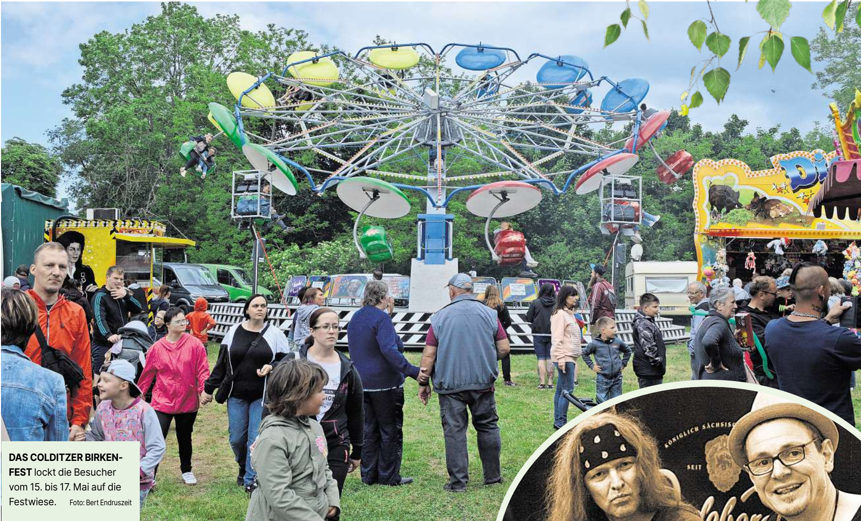
DAS COLDITZER BIRKENFEST lockt die Besucher vom 15. bis 17. Mai auf die Festwiese.