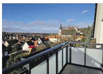
Wohnen mit Aussicht: Blick über Colditz und das Umland

In attraktiver Wohnlage – nur wenige Gehminuten von Stadtzentrum und Tiergarten entfernt – erwartet Sie ein hochwertig und energetisch umfassend saniertes Mehrfamilienhaus mit traumhaftem Blick über die Stadt und das Umland. Die 3-Raum-Wohnung überzeugt mit moderner Wohnqualität, durchdachtem Grundriss und zukunftsorientierter Technik.