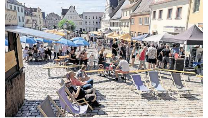
Der nächste Kulturmarkt findet in Colditz am 10. Mai statt.