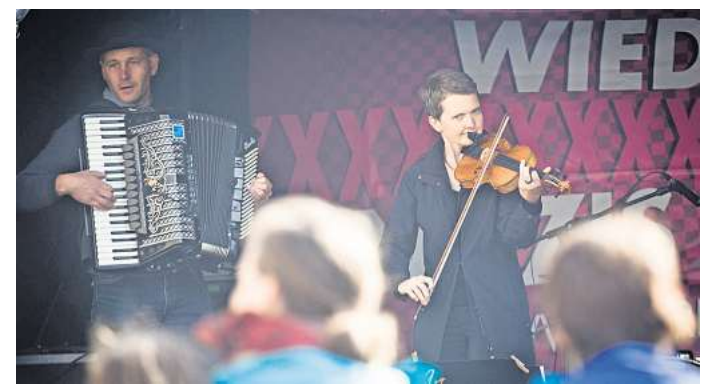
Die Dresdner Band Klezmart spielt am 17. Mai auf Schloss Mutzschen.

Durch das sächsische Themenjahr „Tacheles 26“ wird nunmehr möglich, dass auch auf Schloss Mutzschen am 16. und 17. Mai endlich wieder einmal richtig das Tanzbein geschwungen wird. An beiden Tagen beginnt es um 15 Uhr und endet um 19 Uhr. Die Gastgeber heißen zu diesem Ereignis mit den vier Bands alle Interessierten