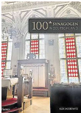
Der Berliner Autor Alex Jacobowitz stellt sein Buch „100+ Synagogen in Deutschland“ in Wurzen vor.

Einige Synagogen überlebten den Krieg, die jüdischen Gemeinden jedoch oft nicht. Das Buch „100+ Synagogen in Deutschland“ zeigt stolz die Gegenwart dieser Gebetshäuser, die erhalten geblieben sind, umfunktioniert wurden und weiterhin das jüdische Erbe erkennen lassen, sowie neue Synagogen, die von den wiederbelebten Gemeinden erbaut wurden.