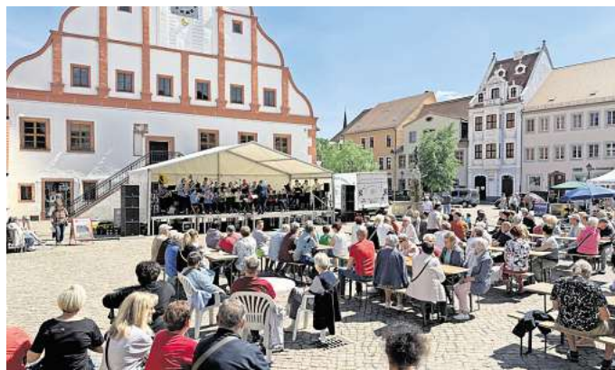
Das Jugendblasorchester Grimma lädt am 10. Mai zum Muttertagskonzert auf den Marktplatz Grimma ein.