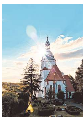
„Kirche im Dialog“ kann man am 8. Mai in der Wohnzimmerkirche in Döben erleben.

DÖBEN. Die Wohnzimmerkirche ist ein Gottesdienst für Anfänger – ein Setting, in das man bedenkenlos kommen kann, auch wenn man noch nie in seinem Leben bei einem Gottesdienst war. Das Prinzip heißt am 8. Mai ab 18.30 Uhr: „Kirche im Dialog“: Sitzen miteinander, lauschen, essen, singen und erzählen über große Fragen, wie „Was war das Erste, was du heute Morgen gedacht hast?“, „Welche Figur in der Weihnachtsgeschichte wärest du wohl gewesen?“ oder „Wovon träumst du?“