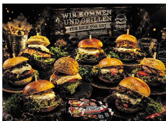
Metzgerei Wenzel aus Grimma bezieht das Rindfleisch nur von regionalen Anbietern.

Gerade diese Verbindung aus Regionalität und moderner Burgerkultur macht den Unterschied.