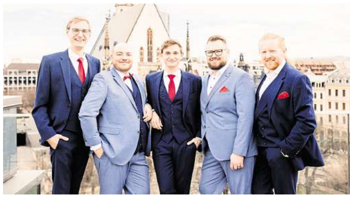
Das Ensemble Nobiles.

Das preisgekrönte Ensemble Nobiles feiert in diesem Jahr sein