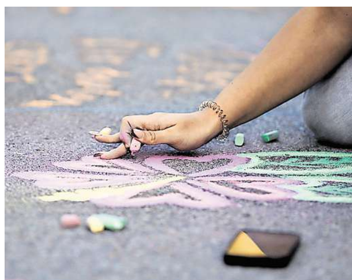
Mitmachen bei der im:puls Nacht: Bis 12. Juli kann man sich bewerben, um eine 500-Euro-Projekthilfe zu bekommen.

im:puls ist ein Projekt der Landesvereinigung Kulturelle Kinder- und Jugendbildung (LKJ) Sachsen – und ein Teil des Projekts ist die Sächsische Nacht der Jugendkulturen, kurz: im:puls Nacht. Die Aktionsnacht hat zum Ziel, die kulturellen Interessen und kreativen Ausdrucksformen von jungen Menschen im Alter von 14 bis 27 Jahren in sächsischen Gemeinden mit maximal 40.000 Einwohnenden