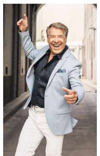
Patrick Lindner kommt nach Hartha.

Gemeinsam werden sie den Saal zum Kochen bringen und unvergessliche Momente schaffen. „Musik für Euch“ ist ein Erlebnis für alle, die Schlager lieben, gute Unterhaltung schätzen und die Nähe zu ihren Künstlern genießen. Ein Abend voller Emotionen, Hits, Lachen und vielen Überraschungen! Seid dabei, wenn Uta Bresan und ihre Gäste zeigen, dass Musik mehr kann als unterhalten – sie verbindet! Zu erleben am 17. Oktober 2026 in Hartha.