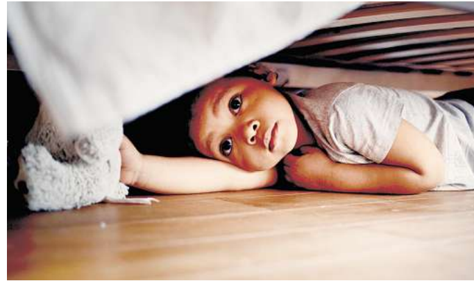
Beim Brand reagieren Kinder häufig nicht mit Flucht, sondern verstecken sich unter dem Bett. Wichtig ist, dass Eltern so früh wie möglich alarmiert werden.

Mehr Infos: www.rauchmelder-sind-pflicht.de