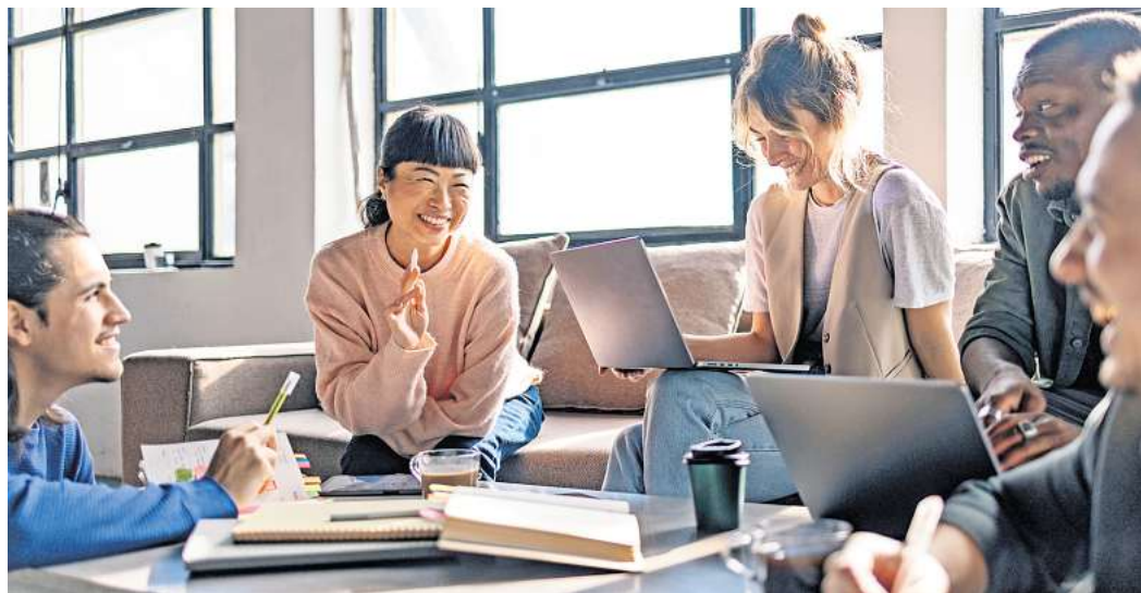
Teamfähigkeit oder Kundenorientierung sind ebenso gefragt wie formale Bildungsabschlüsse.

VOM PRAKTIKUM BIS ZUM QUEREINSTIEG: Chancen in einer Branche im Wandel