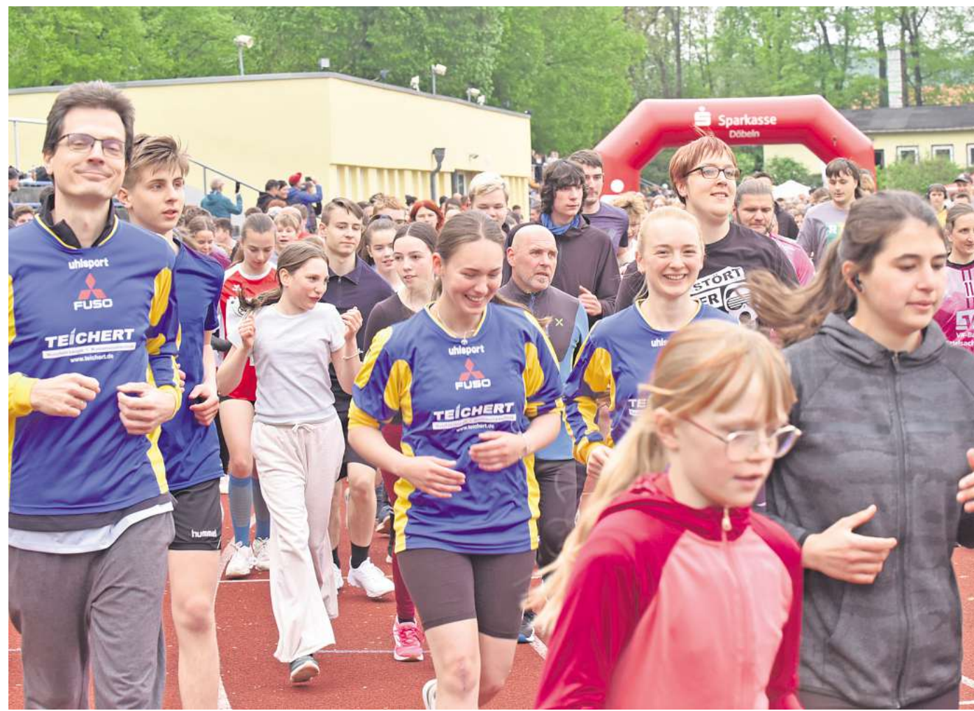
Über 20.000 Euro sammelten die Döbelner beim Lauf mit Herz des Lessing-Gymnasiums für krebskranke Kinder.