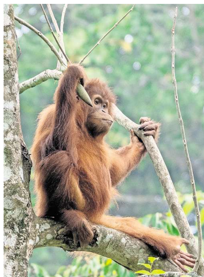
Zu Hause in der Auffangstation auf Sumatra: „Brenda“ ist sieben Jahre als und der Paten-Orang-Utan des Leipziger Vereins um Sebastian Schorr.