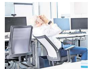
Wenn alles gleichzeitig rein prasselt: Kleine Rituale oder sogar Selbstgespräche können helfen, den Stress im Job zu sortieren.

Der vierte Tipp: Dem Körper Stopp signalisieren. Verfällt man