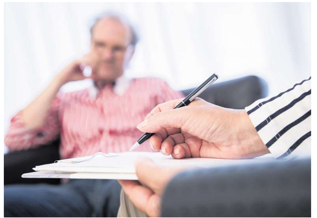
Erschöpft, gereizt, schlechter Schlaf über Wochen: Manchmal brauchen Beschäftigte, die sich im Beruf stark belastet fühlen, professionelle Hilfe.