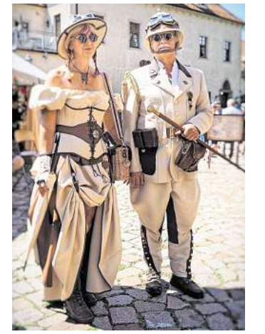
Steampunk in all seinen Facetten wird am 16. Mai im Bürgergarten Döbeln geboten.

Das größte Steampunk-Festival in Ostdeutschland findet jährlich im Juli auf dem Domplatz in Meißen statt, organisiert von dem Verein Zahnrad & Zylinder e.V., dem ersten Steampunk-Verein in Deutschland. Dieser Verein ist nicht nur in Meißen aktiv, sondern auch überregional unterwegs. Fünf Jahre lang richteten sie ein Steampunkfest im Industriemuseum Chemnitz aus und sind im vierten Jahr Mitveranstalter des Steampunk & Irish-Folk-Festivals im Schloss Burgk in Freital. In diesem Jahr werden sie zudem erstmals beim Hof-