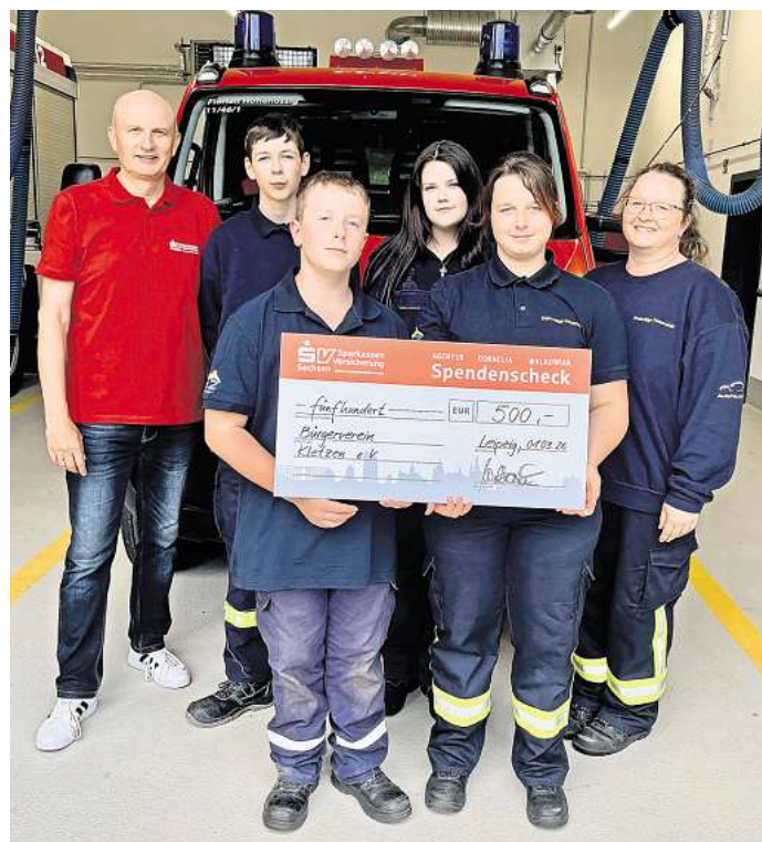
Die Jugendfeuerwehr wird bei der Aktion dank der Sparkassen-Versicherung Sachsen Agentur Walkowiak mit einem extra Scheck bedacht und dürfen nun ihre Wünsche damit umsetzen.