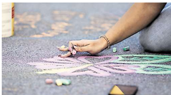
Mitmachen bei der im:puls Nacht: Bis 12. Juli kann man sich bewerben, um eine 500-Euro-Projekthilfe zu bekommen.

SACHSEN. Junge Menschen mit kreativen Ideen aus ganz Sachsen gesucht: im:puls – die achte Sächsische Nacht der Jugendkulturen – findet in diesem Jahr am 18. und 19. September statt. An diesen beiden Tagen stehen kulturelle Aktionen von Jugendlichen und für Jugendliche im Mittelpunkt. Bis zum 12. Juli können interessierte Jugendgruppen, Vereine und Einrichtungen, die mit Jugendlichen zusammenarbeiten, ihre Bewerbungen einreichen.