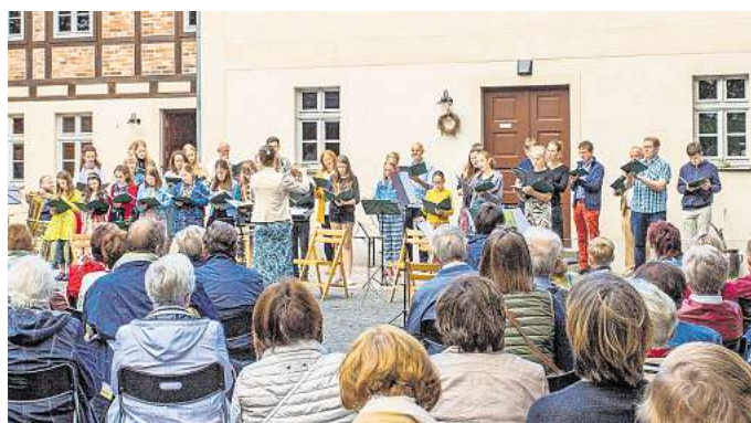
Die Kurrende beim Sommerkonzert an der Obermühle bei strahlendem Sonnenschein.

BAD DÜBEN. Mit einem sommerlichen Open-Air-Konzert gehen Kurrende und Posaunenchor gemeinsam mit dem Publikum auf eine Reise in die Welt der Musicals. Unter dem Titel „Let's sing the stage – Die Welt der Musicals im Freien“ erklingt am 20. Juni um 19 Uhr ein abwechslungsreiches Programm im Museumsdorf Obermühle in Bad Düben. Der Kartenvorverkauf hat bereits begonnen. Tickets gibt es für 8, ermäßigt 6 Euro im Blumenladen „Der gute Blumen-Geist“ (Pfarrhäuser 7).