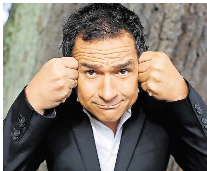
Kabarettist Stephan Bauer kommt am 25. Oktober mit seinem neuen Programm ins Volkshaus Döbeln.

Tickets für die Show sind an allen bekannten Vorverkaufsstellen erhältlich.