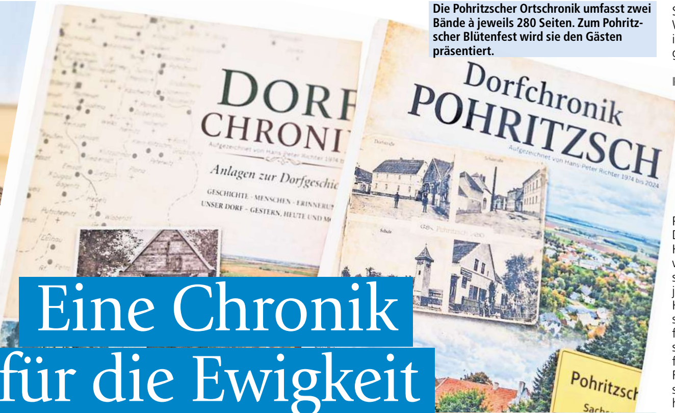
Die Pohritzscher Ortschronik umfasst zwei Bände à jeweils 280 Seiten. Zum Pohritzscher Blütenfest wird sie den Gästen präsentiert.