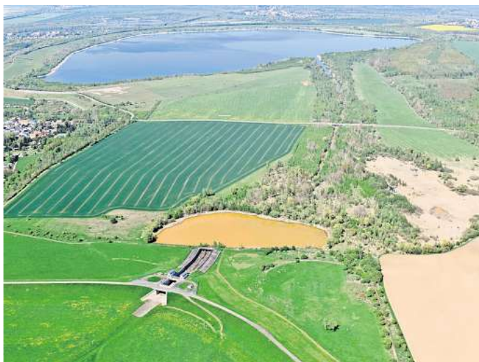
Blick auf das Speicherbecken Borna (oben) von Süden; links die Ortslage Regis

Bis zur Realisierung gilt für die Adria und ihr Umfeld: Nutzung möglich „unter Verhaltensanforderungen“, die das Sächsische Oberbergamt erlassen hat. Heißt: Der Schäfer darf seine Tiere weiden, damit das Gelände nicht zuwächst. Der Fischer darf auf das Wasser wie die Talsperrenverwaltung. Der Surfclub Sachsen, der am Ostufer sein Camp hat, muss indes an Land bleiben, darf seinen Stützpunkt aber nutzen. Für Spaziergänger kennzeichnen Verbotsschilder im Abstand von 50 Meter die Tabu-Zone um den Speicher. ES