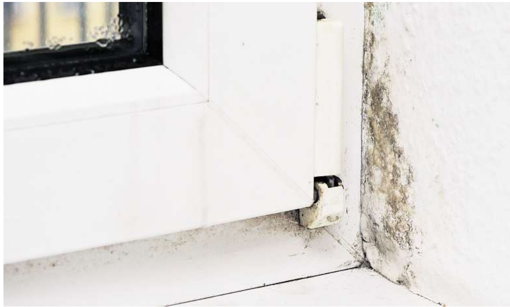
MIT 70-PROZENTIGEM ETHYLALKOHOL soll sich kleinflächiger Schimmelpilz in der Wohnung beseitigen lassen.

Decken Sie schwer zu reinigende Gegenstände wie Sofas vor den Arbeiten ab oder tragen Sie sie aus dem Raum. Auch Lebensmittel oder Kinderspielzeug und Kleidung sollte man vorher wegräumen.