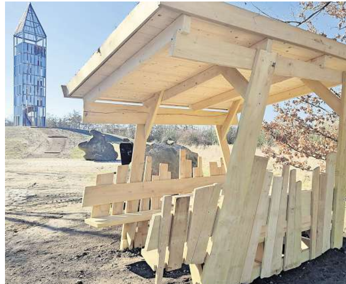
Der Aussichtsturm ist dicht. Nutzbar sind hingegen die neuen Rasthütten, die Ausflügler und Radtouristen zum Verweilen einladen.

lange das dauert. „Vorerst bleibt der Turm deshalb für den Besucherverkehr geschlossen.“ Wenigstens die neu auf-