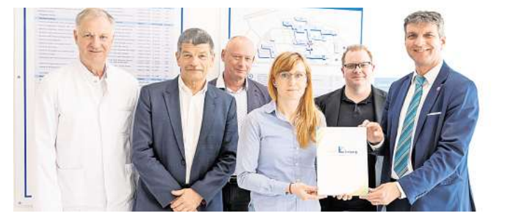
Vertreter von Klinikum und Landkreis freuen sich über den Förderbescheid.

sen der Sana-Kliniken. Im klinischen Alltag fallen täglich große Mengen an Patientendaten an – von Arztbriefen über Laborberichte bis hin zu Diagnosen. Diese Informationen sind digital vorhanden, müssen jedoch häufig zeitaufwendig manuell durchsucht werden. Genau hier setzt SLINA an: Die KI analysiert sämtliche vorhandenen Dokumente eines Patienten innerhalb weniger Sekunden und liefert gezielt Antworten auf konkrete Fragestellungen. Das spart Zeit und ermöglicht es Ärztinnen und Ärzten, sich stärker auf die Behandlung zu konzentrieren. Ein besonderer Fokus liegt auf der