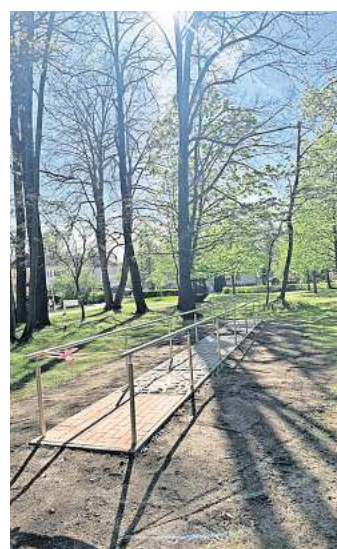
Blick auf die Anlage.

Spendenscheck würdigt doppeltes Engagement der FREIWILLIGEN FEUERWEHR BUCHHEIM