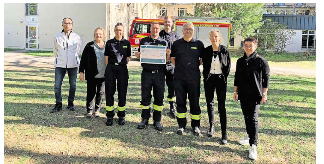
Der Gehparcours ist fertig – große Freude bei allen Beteiligten.