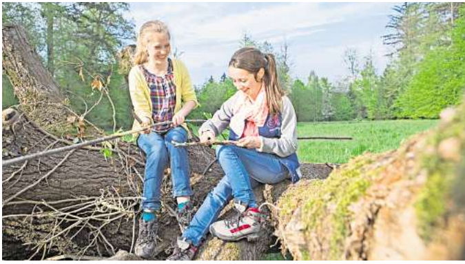
Für Kinder und Jugendliche ist der Wald gleichermaßen ein großer Abenteuerspielplatz wie ein Ort zum Entdecken und Lernen.

lässt sich gut erklären, wie Holz genutzt und verarbeitet wird – und wie daraus Alltagsprodukte wie Schreibblöcke oder Toilettenpapier entstehen. Wer den Wald als Lern-, Natur- und Erlebnisraum schätzt, versteht den Sinn der Regeln, die seinem Schutz dienen. Radfahren ist nur auf geeigneten oder markierten Wegen erlaubt. „Trails“ sollten Aktive nicht nur wegen der Waldtiere und der Vegetation, sondern auch wegen der Rücksichtnahme auf andere Erholungssuchende nie verlassen. Wer aufmerksam durch den Wald geht, findet schmackhafte Leckereien, die für den eigenen Gebrauch gesammelt werden können: zum Beispiel Löwenzahn, Giersch oder Walderdbeeren und Brombeeren (mehr Infos unter www.pefc.de ). DJD