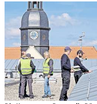
Die Kampagne „Ran an die Dächer“ zeigt die Möglichkeiten rund um die Solarenergie im Landkreis Leipzig.

LANDKREIS LEIPZIG. Der Landkreis Leipzig ist und bleibt Energieregion. Die Kampagne „Ran an die Dächer“ zeigt eindrucksvoll die Bedeutung und Möglichkeiten rund um die Solarenergie auf der „Sonnenseite Leipzigs“. Rund 185 000 Gebäude gibt es, doch nur jedes zehnte hat eine Solaranlage. Dabei könnten geeignete Dachflächen jährlich etwa 1300 Gigawattstunden Strom liefern, rund 85 Prozent des Verbrauchs der gesamten Region. Landrat Henry Graichen betont: „Der Stromverbrauch steigt, also ran an die Dächer.“ Alles dreht sich