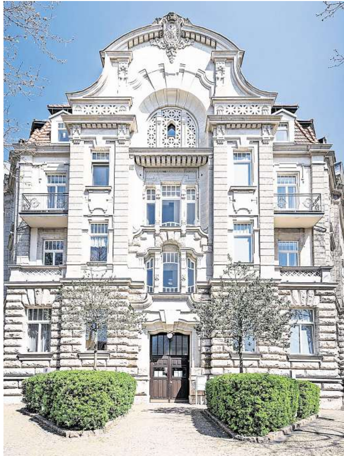
Ein individuelles Zuhause mit einem starken Gemeinschaftsgefühl: Das AZURIT Seniorenzentrum Palais-Balzac in Gohlis ist eines von drei Seniorenzentren in Leipzig.

Ein besonderes Merkmal der AZURIT Einrichtungen ist das Betreuungskonzept für Menschen mit Demenz. In sogenannten offenen behüteten Bereichen wird ein geschütztes, gleichzeitig frei gestaltbares Lebensumfeld geboten. Hier können sich die Bewohnerinnen und Bewohner