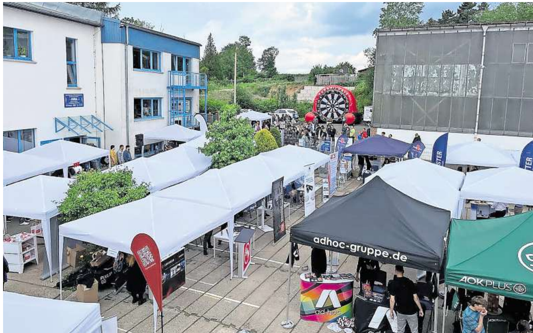
AUCH BEI DER 6. AUFLAGE DES AWA JOB-FESTIVALS in Altenburg geht es auf dem AWA-Gelände in Altenburg mit Sicherheit wieder hoch her.

Mit über 40 Unternehmen aus der Region – von Industrie, Handwerk, Pflege bis hin zu Justizvollzugsanstalt mit einem Gefangenen-Transportfahrzeug ist alles dabei – zählt das AWA Job-Festival inzwischen zu den größten Veranstaltungen seiner Art im Altenburger Land. Unternehmen aus unter anderem Altenburg, Gera, Schmöln, Jena, Meuselwitz und Lucka präsentieren ihre beruflichen Perspektiven und treten direkt mit potenziellen Fachkräften in Kontakt. Entstanden ist das Format aus dem Bedarf der Unternehmen, Ausbildungsplätze und offene Stellen erfolgreich zu besetzen. Künftige Auszubildende, Studierende, Berufseinsteiger, Weiterbildungsinteressierte oder Wechselwillige haben von 13 bis 18