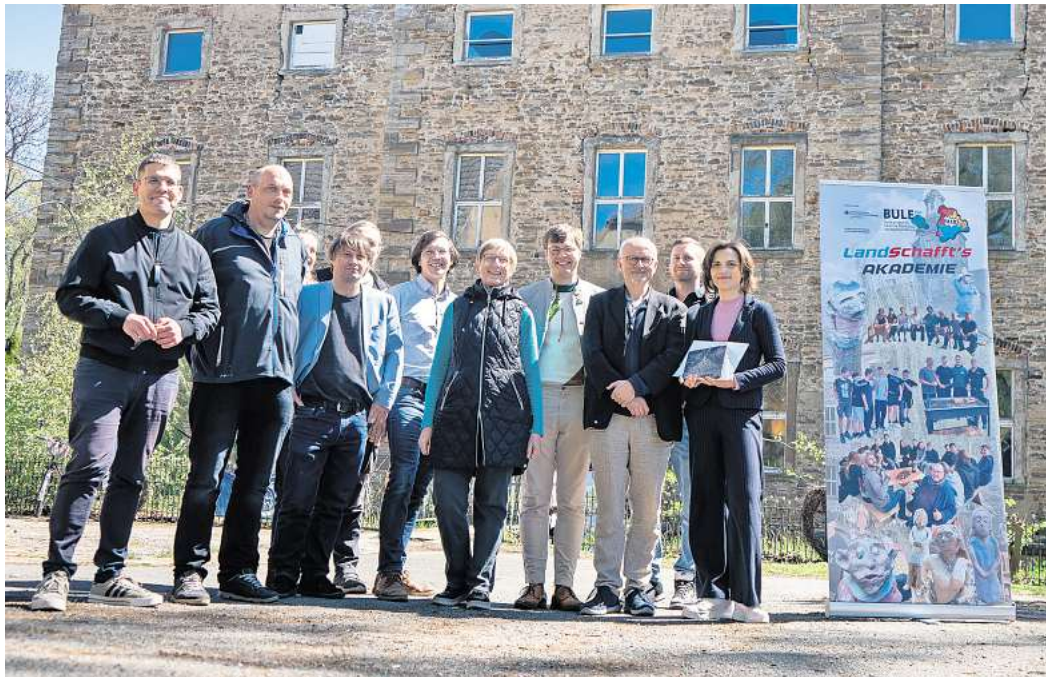
Großer Bahnhof: die Ostbeauftragte der Bundesregierung, Elisabeth Kaiser, führte am Wasserschloss in Dobitschen einige Gespräche.

Die Ostbeauftragte der Bundesregierung, Elisabeth Kaiser, besuchte Ende April das WASSERSCHLOSS IN DOBITSCHEN