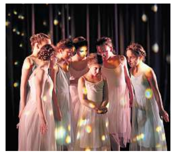
Das Kinder- und Jugendballetts des Theaters Altenburg Gera ist an diesem Wochenende zweimal zu erleben.

Infos und Karten in den Theaterkassen, telefonisch unter 0365 8279105 (Gera) bzw. 03447 585160 (Altenburg) sowie online unter www.theater-altenburg-gera.de .