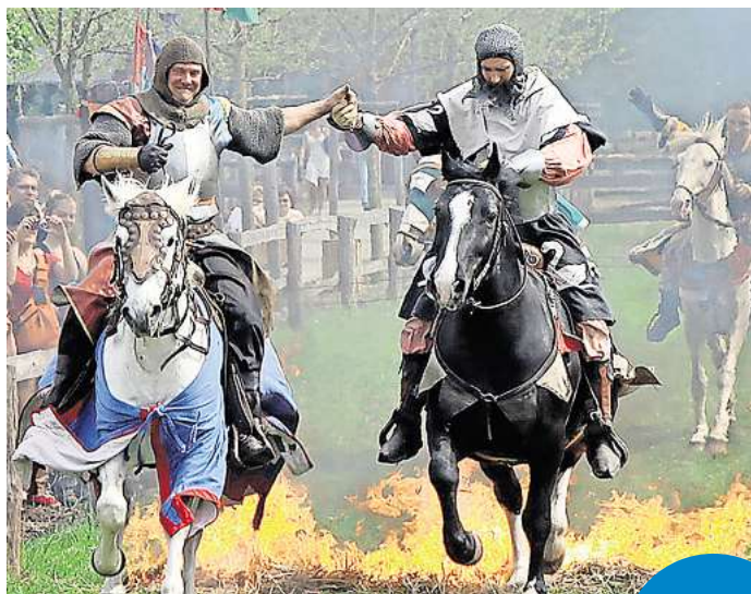
Wenzels Ritterschaft sorgt auch bei der Jubiläumsausgabe des Ritterturniers für spektakuläre Bilder auf Burg Posterstein.

Wie es Sitte und Brauch war im Mittelalter, findet sich an diesen Tagen auch allerley Künstlervolk auf dem Markte ein, um das Volk auf das Trefflichste zu unterhalten. In diesem Jahr sorgt „Rudolfo“ mit einer atemberaubenden Feuershow für Staunen und lässt die Funken hoch in den Himmel steigen.