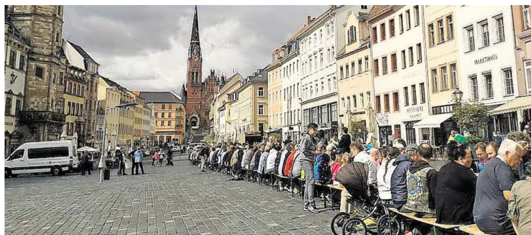
Die 46. Auflage der Aktion „Altenburg isst gemeinsam“ findet am 5. Mai auf dem Altenburger Markt statt.

Durchgeführt wird die Aktion „Altenburg isst gemeinsam“ von den Johannitern, der Diakonie, der Evangelischen Jugend und dem Christlichen Spalatin-Gymnasium. Auch auf schlechtes Wetter wird der Arbeitskreis vorbereitet sein.