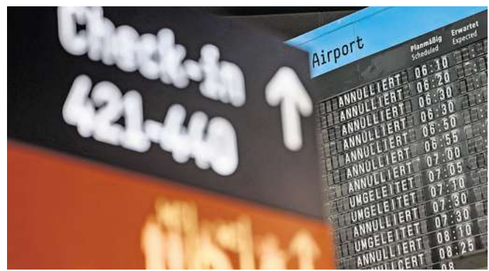
Musterbriefe für Flugärger: Neue Vorlagen helfen Reisenden, Ansprüche bei Flugverspätungen oder Ausfällen einfach geltend zu machen.

Wer sich nicht sicher ist, welche Rechtsansprüche Flugreisenden konkret zustehen, kann das mit einem kleinen Werkzeug auf der Website des EVZ prüfen. Hier kann aus vorgegebenen Szenarien ausgewählt werden - dann bekommt man Informationen zu Fluggastrechten und Empfehlungen angezeigt. Je nach Fall kann auch gleich ein Muster schreiben verfasst werden. DPA