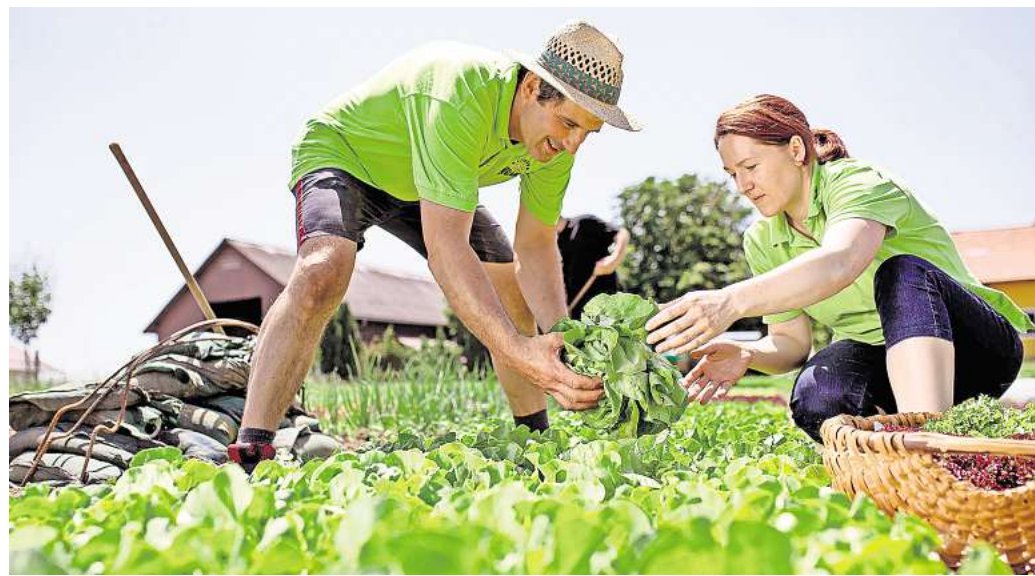
In der Region Waginger See – Rupertiwinkel blüht die Bio-Landwirtschaft.

Kulinarische ENTDECKUNGSREISEN in der neuen Erlebnisregion