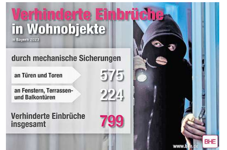
Mechanische Schutzmaßnahmen können Einbruchversuche verhindern, wie diese Zahlen aus Bayern belegen. Fachleute empfehlen, solche Sicherungen um eine moderne Alarmanlage zu ergänzen. Grafik: Claudia Barz/djd/BHE

Qualifizierte Fachfirmen in der Region findet man etwa über eine PLZ-Suche auf dem neutralen Informationsportal www.sicheres-zuhause.info . Dort gibt es zudem für Interessierte viele Tipps rund um den Einbruchschutz. DJD