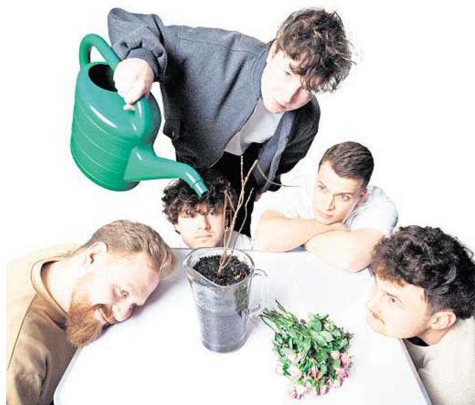
Mit der neuen Single „Sauvignon“ am Start: Die Leipziger Band 5Raumfenster.

Nicht schlecht, nicht schlecht ... oder besser gesagt richtig gut: