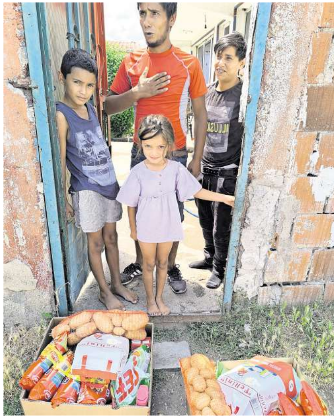
Hilfe für die Ärmsten der Armen im Kosovo: Dafür sammelt der Leipziger Verein „Perspektiven für Kinder auf dem Westbalkan“ wieder Spenden.

Deshalb startet der Verein einen Aufruf an die Leipzigerinnen und Leipziger: „Wir wären Ihnen sehr dankbar, wenn Sie besonders diesen Kindern auf dem Westbalkan, die absolut zu den Ärmsten in dieser Region zählen, mit einer Spende helfen würden. Wichtig ist, dass die Mittel direkt bei den Kindern auf dem Westbalkan ankommen und nicht in der Verwaltung versickern. Deshalb finanzieren wir als gemeinnütziger Verein unse-