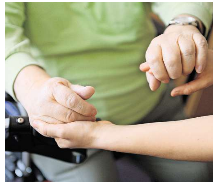
VORSICHT VOR UNSERIÖSEN ANBIETERN: Betrüger geben sich als Pflegedienstleister aus und versuchen, den Entlastungsbetrag unrechtmäßig abzuschöpfen.