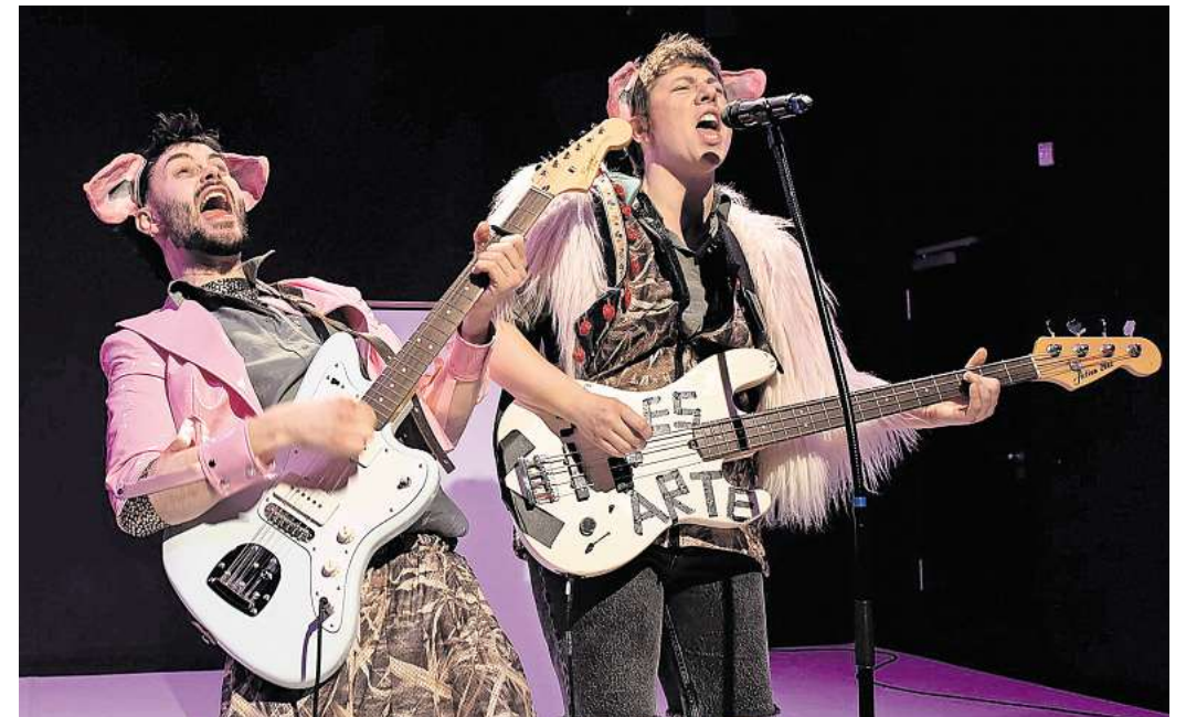
Sie ist bunt, aufregend und gemeinschaftstiftend zwischen Musik, Theater und mehr – wie hier im Loft beim Stück „Knallkreb, Kuckuck & Co“: Leipzigs Freie Szene hat aber auch eine Bedeutung als Wirtschaftsfaktor, zeigt eine neue Analyse der Stadtverwaltung.

Nun ist eben diese Förderung auch gern mal ein Streitpunkt – und auch da gibt es spannende Hintergrund-Informationen: So habe das Zusammentragen der Daten gezeigt, dass anno 2024 jeder Euro der Kulturförderung zusätzlich weitere 3,20 Euro generiert hat – über Eigenmittel, Drittmittel oder zusätzliche öffentliche Förderung. Womit sich das Ganze zu einem ernstzunehmenden Wirtschaftsfaktor maulert: Allein die institutionell geförderten Einrichtungen der