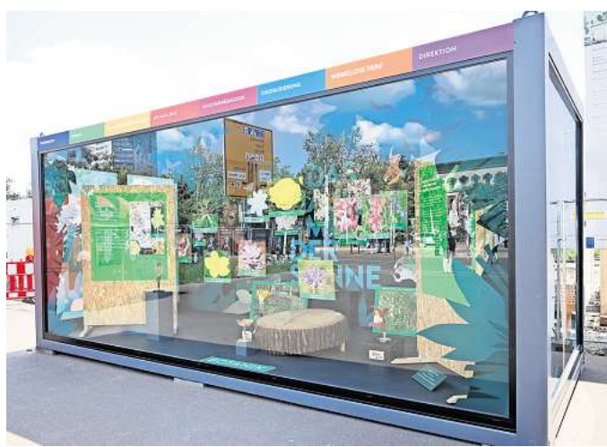
„Tapetenwechsel“ in der ExpoBox: Nun fallen auf dem Wilhelm-Leuschner-Platz botanische Objekte ins Auge.