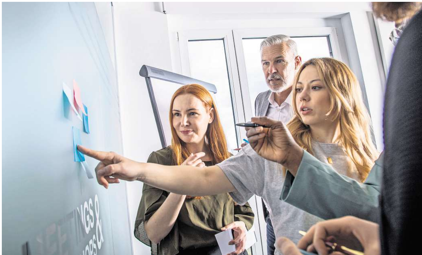
BEI JEDEM JOB IST UNGEWISS, ob es ihn mit dem gleichen Aufgabenprofil wie heute noch in 40 Jahren gibt.

Aber egal, um was es geht: „Bei jedem Job ist ungewiss, ob es ihn mit dem gleichen Aufgabenprofil wie heute auch noch in 40 Jahren gibt“, so Maier. Das war aber auch schon immer so und ist nicht per se etwas Negatives. „Für Beschäftigte bedeutet dies, dass sie immer bereit sein müssen, sich mit Neuem auseinanderzusetzen“, sagt Britta Matthes vom Institut für Arbeitsmarkt- und Berufsforschung (IAB) in Nürnberg. Zum Beispiel mit KI.