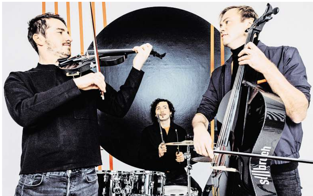
ERÖFFNEN DIE STÖTTERITZER SOMMERKONZERTE: Die Musiker von der Band Stilbruch spielen am 30. Mai in der Marienkirche.

Für einen standesgemäßen Auftakt am Samstag, 30.