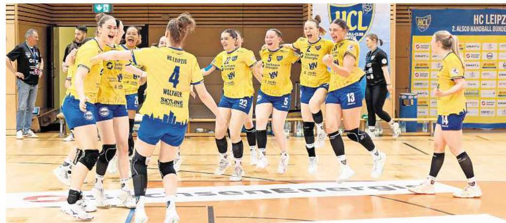
Sie haben den Aufstieg wieder in der Hand und feiern dies kräftig: Die HCL-Spielerinnen jubeln nach dem Heimsieg über den Bergischen HC.

Leipzigerinnen nach Top-Wochenende wieder GANZ OBEN