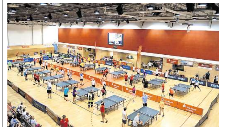
Runter vom Bürostuhl, ran an die Platte: Am 5. Mai findet der nächste Sparkassen Tischtennis Firmen-Cup in Leipzig statt.