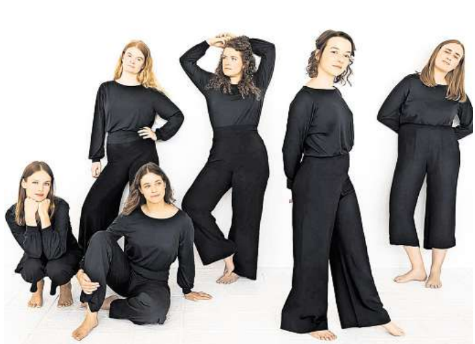
Heimspiel Nummer 1: Das international gefeiert Leipziger Vokalensemble Sjaella kann man bei chor.com live erleben und zwar am 2. Oktober in der Philippuskirche.