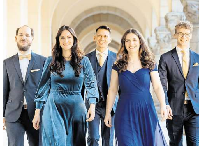
Heimspiel Nummer 2: Auch das Leipziger Calmus Ensemble lädt zu einem Konzert. Am 3. Oktober lautet das Motto in der Philippuskirche „Bach im Dialog“.

demie und der Kammerchor Stuttgart, die Latvian Voices und das Chorwerk Ruhr und und und ... Ach ja: erleben kann man die Konzerte im Kupfersaal, in der Peterskirche, der Philippuskirche