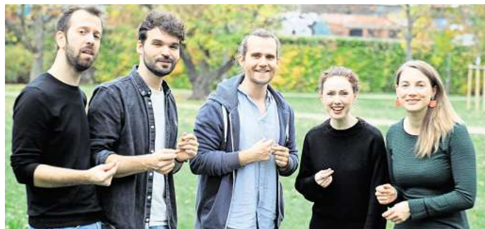
Heimspiel Nummer 3: Die a-cappella-Band Quintense aus Leipzig bittet am 1. Oktober in den Kupfersaal und bringt „Bridges – Klassik trifft Pop“ zu Gehör.

Letzter Hinweis zu den erwähnten Workshops: Da kommen zahlreiche Dozentinnen und Dozenten vom 1. bis 4. Oktober in die Messestadt – und offen stehen diese Workshops auch allen, die sich für Vokalmusik interessieren. RED./JW