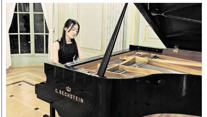
Auch in diesem Jahr wird wieder gespielt im Gohliser Schösschen: Bis 10. Mai lockt das fünfte Klavierfestival der Stiftung Elfrun Gabriel.