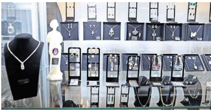
Einzigartig: Der Schmuck bei Antiquitäten Wendt.