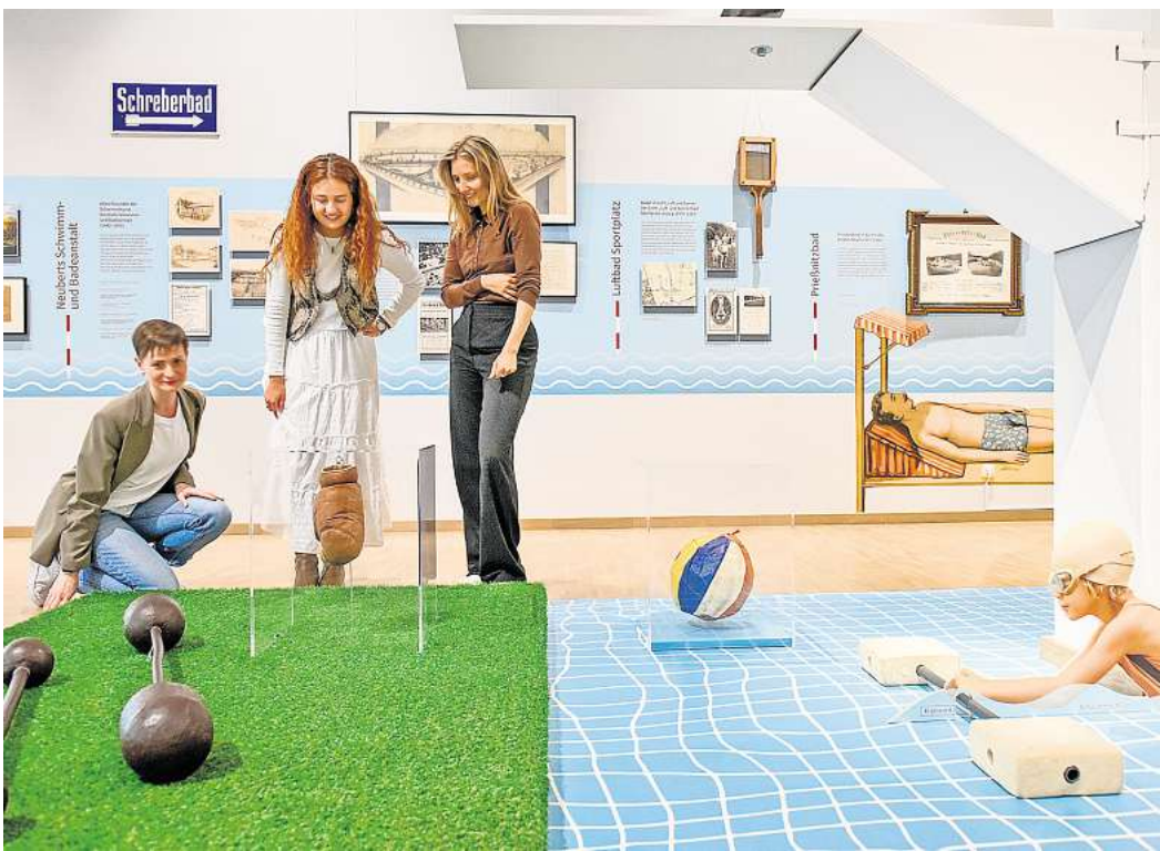
Sommerliche Gefühle und Sonne satt: Dies bietet die neue Sonderausstellung im Stadtgeschichtlichen Museum Leipzig.

Doch dieser sonnig-heitere Blick auf die Leipziger Sommergeschichte wäre nur die halbe Wahrheit. Extreme Hitzeperioden, Dürreperioden und Unwetter gehören ebenso zu dieser Jahreszeit und stellen die Leipzigerinnen und Leipziger vor besondere Herausforderungen – mit steigender Tendenz. Städtebau neu denken und mehr Grün auf Plätzen, Häuserwänden und Dächern sind beispielhafte Instrumente dafür, dass die kommenden Sommer in Leipzig eine angenehme und aushaltbare Jahreszeit bleiben. Gelingt dies nicht, hat man ganz schnell die sommerliche Sonne satt.