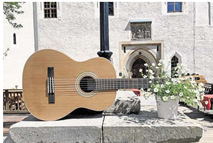
Schülerinnen, Schüler und Lehrende der Musik- und Kunstschule Landkreis Leipzig präsentieren ein Potpourri verschiedener Stilrichtungen auf Schloss Wurzen.

Musik- und Kunstschule Landkreis Leipzig lädt am 7. Juni zum SOMMERKONZERT NACH WURZEN ein