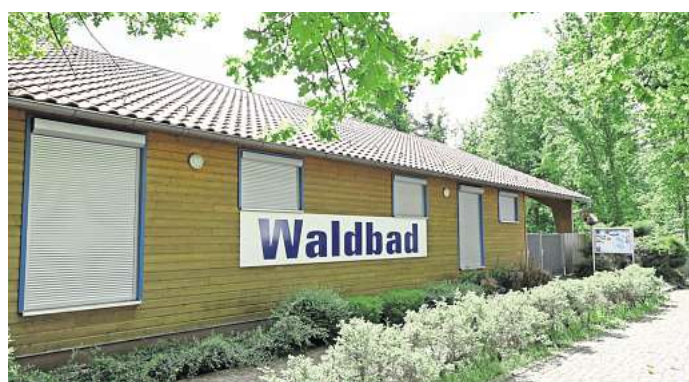
Das „Summer Opening“ wird am 6. Juni im Waldbad Naunhof gefeiert.

Unter dem Motto „Summer Opening“ soll nicht nur die Waldbad-Saison eröffnet werden, sondern die Besucher erwartet darüber hinaus ein mitreißender Abend voller Live-Musik, ausgelassener Stimmung und echtem Festival-Feeling. Für den perfekten Soundtrack sorgen die Rockband RedRocks, die mit kraftvollen Gitarrenriffs und einer mitreißenden Bühnenpräsenz begeistern, sowie die Fuchsschwänze, die für legendäre Stimmung und unvergessliche