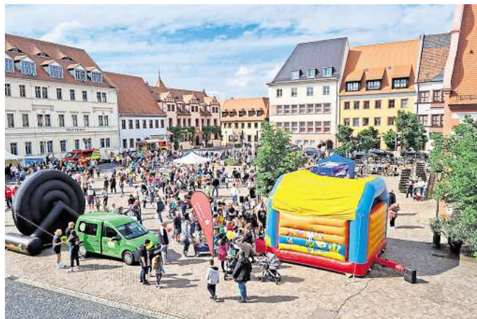
Spiel und Spaß erwartet die Kinder am 1. Juni in der Grimmaer Altstadt.

GRIMMA. Anlässlich des internationalen Kindertages veranstaltet die Stadt Grimma am Montag, 1. Juni, ein kleines buntes Familienfest auf dem Markt. Alle Kinder werden an diesem Nachmittag von 14 bis 18 Uhr zum Spielen und Freunde treffen – kurzum zum Spaß haben eingeladen. Auf dem Programm stehen zahlreiche Mitmach-Aktionen, die für Begeisterung sorgen werden. Die Sparkasse bringt eine große Hüpfburg mit, auf der sich die Kleinen nach Herzenslust austoben können. Für Bewegung sorgt ein spannender Parcours, gestaltet von medive, bei dem Geschick und Koordination gefragt sind. Kreativ geht es an den Bastelständen der Rathaus-