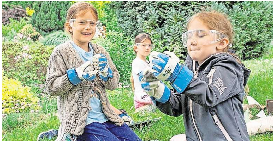
Junge Naturforscher können am 2. und 3. Juni im Wilhelm Ostwald Park experimentieren.

Während am Mittwoch das Geoportal Porphyryhaus Rochlitz an der Station 9 unter dem Motto „Steinalt und Steinreich“ einen Einblick in die Welt der Geologie erlaubt, präsentieren das Geoportal Bahnhof Mügeln und der Geopark Porphyryland am Dienstag, 2. Juni, mit geballter Kraft an den Stationen 7 und 8 Wissenswertes rund um Plattentektonik, Supervulkanismus, und Gesteinsarten. Anschauliche Experimente laden zum Mitmachen, Tüfteln und Staunen ein. Unter anderem gehen kleine Entdecker und Entdeckerinnen Fragen nach wie „Warum gibt es Vulkane?“ „Wie wird man steinreich?“ oder „Was macht