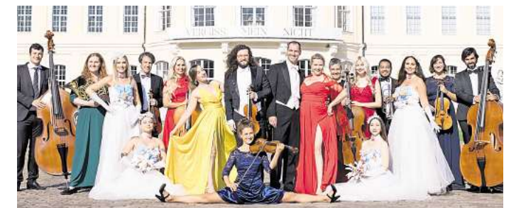
Die Große Johann Strauss Revue kommt zum Konzert am 26. September ins Bürgerhaus nach Döbeln.

Straße 23. Ticket an allen bekannten Vorverkaufsstellen oder online unter: www.johann-strauss-revue.de