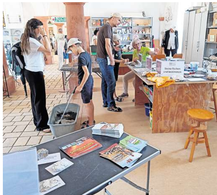
Das Rittergut Trebsen lädt am 7. Juni wieder zum Fest der Edlen Steine ein.

Neben den etablierten Dauer- ausstellungen „Porphyry, Tuff und Co.“ sowie „Edle Steine in