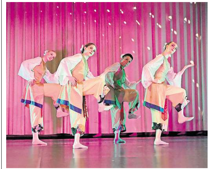
Tänze aus aller Welt wurden kürzlich im Schweizergarten in Wurzen gezeigt.

WURZENER TÄNZERINNEN UND TÄNZER der Musik- und Kunstschule Landkreis Leipzig zeigen ihre Jahresarbeit im Schweizergarten