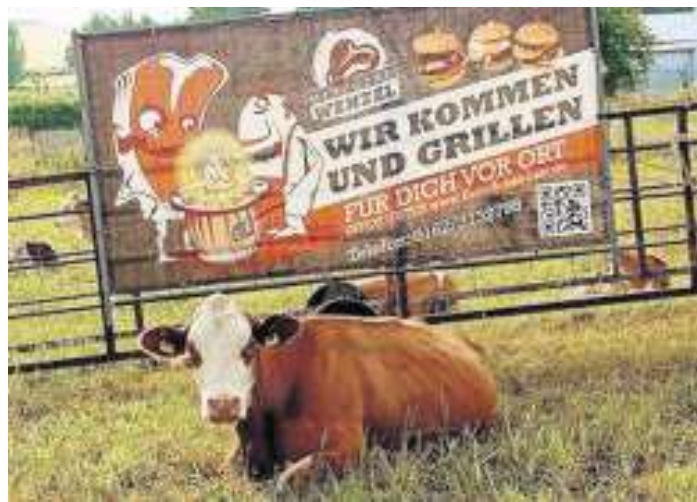
Metzgerei Wenzel aus Grimma bezieht das Rindfleisch nur von regionalen Anbietern.

Gerade diese Verbindung aus Regionalität und moderner Burgerkultur macht den Unterschied.