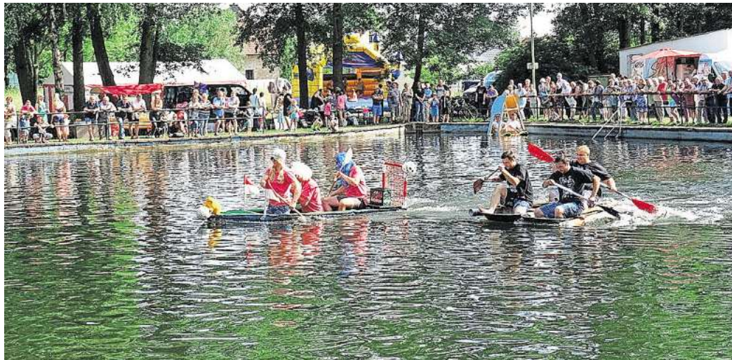
Tolle Tage in Kühren: Ein Höhepunkt wird wieder das traditionelle Elefantenwannenrennen sein.