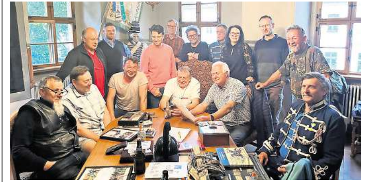
Der Husarenverein Grimma ist eine lebendige Gemeinschaft.

Der HUSARENVEREIN GRIMMA traf sich beim Sammlerstammtisch im Vereinsraum