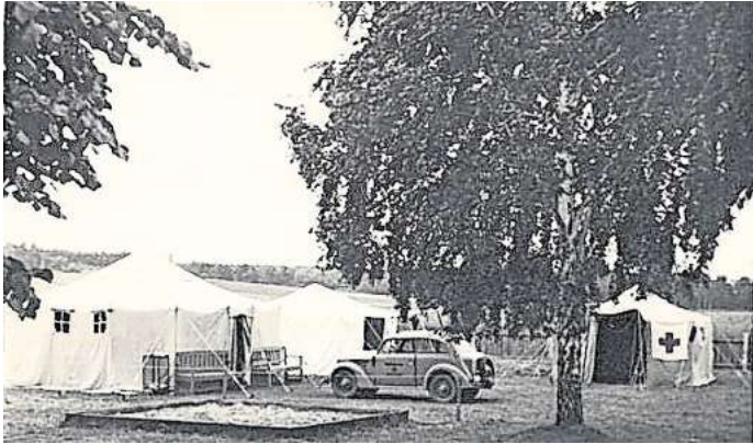
So sah der Campingplatz am Naturbad Mutzschen damals aus.

Ab Mitte der 1970er-Jahre verschlechterte sich die Wasserqualität, sodass der offizielle Badebetrieb eingestellt wurde. Die Stadt Mutzschen zog sich als Betreiber zurück, alle Wasserattraktionen wurden zurückgebaut. Im Jahr 1999 gründete sich der Verein Campingfreunde Mutzschen-Roda. Das Gelände wird seitdem von Vereinsmitgliedern ehrenamtlich geführt und alle Erlöse gehen in die Restaurierung und Pflege des Geländes. Eigentümer ist die Stadt