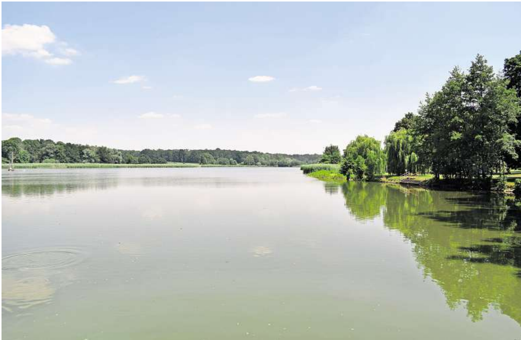
Das Naturbad Mutzschen-Roda gibt es seit 100 Jahren.

Vor allem in den 1960er- und 1970er-Jahren erlebte das Naturbad seine Blütezeit. Eine große Liegewiese, sehr gute Wasserqualität, zahlreiche Wasserattraktionen, eine Saison-Gaststätte sowie ein Campingplatz machten das Bad weit über Mutzschen hinaus bekannt. Viele Kinder lernten hier schwimmen, es fanden Wettkämpfe und beliebte Veranstaltungen wie Strandfeste, Kinoabende und Tanzveranstaltungen statt.