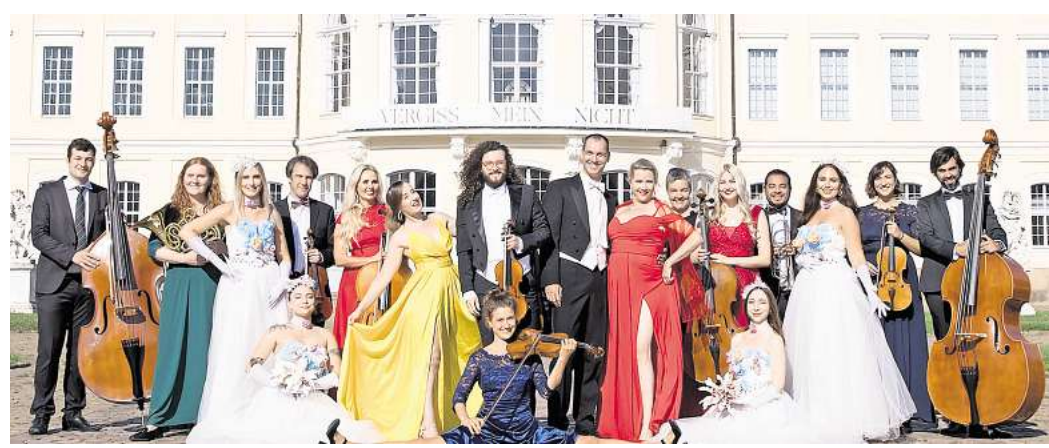
Die große Johann-Strauss-Revue ist im September in Eilenburg zu erleben.

Die Musiker des Wiener-Walzer-Orchesters, die weltweit bereits auf vielen Bühnen gastiert haben, spielen für die Besucherinnen und Besucher die schönsten Melodien des großen Meis-