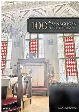
Der Berliner Autor Alex Jacobowitz stellt sein Buch „100+ Synagogen in Deutschland“ in Wurzen vor.

Einige Synagogen überlebten den Krieg, die jüdischen Gemeinden jedoch oft nicht. Das Buch „100+ Synagogen in Deutschland“ zeigt stolz die Gegenwart dieser Gebetshäuser, die erhalten geblieben sind, umfunktioniert wurden und weiterhin das jüdische Erbe erkennen lassen, sowie neue Synagogen, die von den wiederbelebten Gemeinden erbaut wurden.