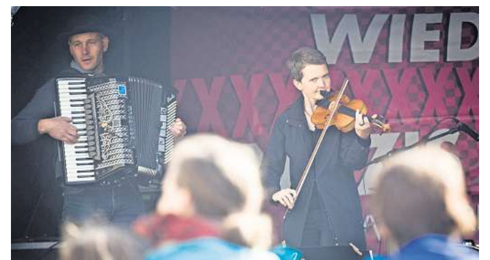
Die Dresdner Band Klezmart spielt am 17. Mai auf Schloss Mutzschen.

Durch das sächsische Themenjahr „Tacheles 26“ wird nunmehr möglich, dass auch auf Schloss Mutzschen am 16. und 17. Mai endlich wieder einmal richtig das Tanzbein geschwungen wird. An beiden Tagen beginnt es um 15 Uhr und endet um 19 Uhr. Die Gastgeber heißen zu diesem Ereignis mit den vier Bands alle Interessierten