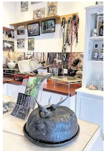
Trüffeljäger aus Eilenburg war für die Autorin ein ganz besonderer Hofladen in Nordsachsen.

Geboren und aufgewachsen ist die heute 51-Jährige in Zeitz. Nach der Schule ging sie nach Leipzig, um Soziologie zu studieren.