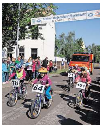
Die kleine Friedensfahrt in Deuben findet am 9. Mai statt.

DEUBEN. Am Samstag, den 9. Mai, lädt die Gemeinde Bennewitz zur „Kleinen Friedensfahrt“ nach Deuben ein. Die beliebte Veranstaltung richtet sich an Kinder, Jugendliche und Junggebliebene und verbindet sportliche Aktivität mit geselligem Miteinander.