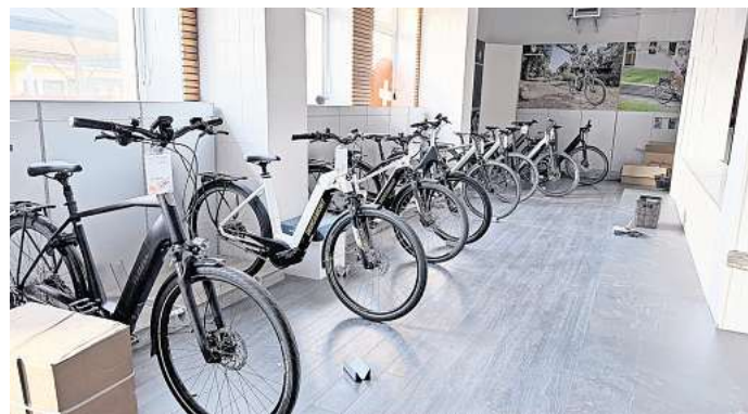
Noch bis 7. Mai ist Räumungsverkauf bei AkkuRad in Leipzig-Seehausen. Es darf nun sogar gehandelt werden.

Alle, die an einem E-Mountainbike interessiert sind, werden wohl noch was finden. „Wer es also sportlich mag, sollte jetzt zuschlagen“, so Michael Syring. Jetzt ist auch Zubehör wie Taschen und Helme drastisch reduziert, auch einige Ge-