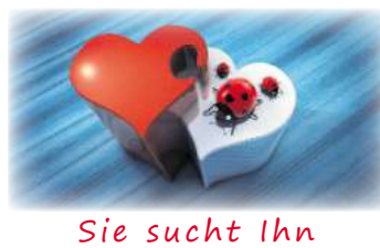
Sie sucht ihn

2x Flohmarkt in Brottewitz und auf dem Schrottplatz, 09.05.26, ab 11 Uhr. ☎ 0172/3599391