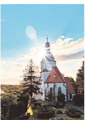
„Kirche im Dialog“ kann man am 8. Mai in der Wohnzimmerkirche in Döben erleben.

DÖBEN. Die Wohnzimmerkirche ist ein Gottesdienst für Anfänger – ein Setting, in das man bedenkenlos kommen kann, auch wenn man noch nie in seinem Leben bei einem Gottesdienst war. Das Prinzip heißt am 8. Mai ab 18.30 Uhr: „Kirche im Dialog“: Sitzen miteinander, lauschen, essen, singen und erzählen über große Fragen, wie „Was war das Erste, was du heute Morgen gedacht hast?“, „Welche Figur in der Weihnachtsgeschichte wärest du wohl gewesen?“ oder „Wovon träumst du?“