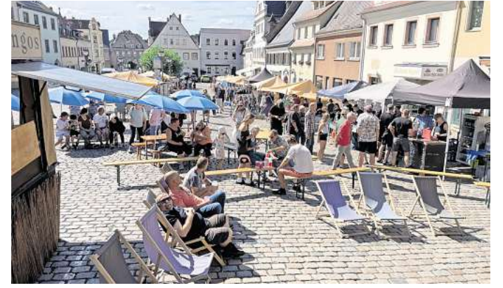
Der nächste Kulturmarkt findet in Colditz am 10. Mai statt.