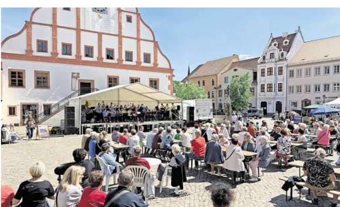
Das Jugendblasorchester Grimma lädt am 10. Mai zum Muttertagskonzert auf den Marktplatz Grimma ein.