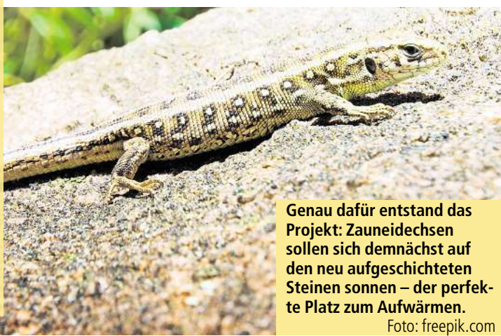
Genau dafür entstand das Projekt: Zauneidechsen sollen sich demnächst auf den neu aufgeschichteten Steinen sonnen – der perfekte Platz zum Aufwärmen.

In nur drei Monaten schafft die BEHLITZER NATURSCHUTZ-JUGEND mit viel Einsatz ein NEUES ZUHAUSE FÜR ZAUNEIDECHSE , Blindschleiche und Co.