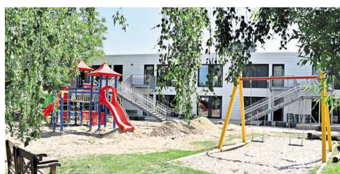
Blick über Spielplatz zum Erweiterungsbau der ASB-Kindertagesstätte Eilenburger Heinzelmännchen. Hier findet das diesjährigen Sommerfest statt.

Die Einrichtung wurde in den letzten Jahren von der Stadt Eilenburg saniert und erweitert. Oberbürgermeister Ralf Scheler konnte den modernen Erweiterungsbau gemeinsam mit den Projektpartnern im Mai 2024 einweihen. Seitdem können 198 Kinder im Alter von 9 Monaten bis zum Schuleintritt betreut werden. Zurzeit gibt es noch freie Plätze.