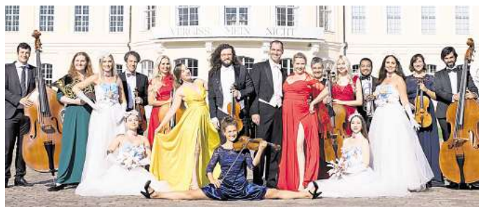
Die Große Johann Strauss Revue kommt zum Konzert am 26. September ins Bürgerhaus nach Döbeln.

Die große Johann-Strauss-Revue am 26. September, um 15.30 Uhr (Einlass 14.30 Uhr) im Bürgerhaus Eilenburg, Franz-Mehring-Straße 23. Ticket an allen bekannten Vorverkaufsstellen oder online unter: www.johann-strauss-revue.de