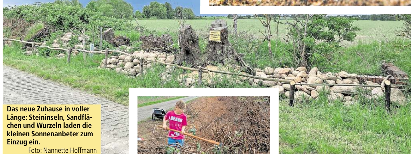
Das neue Zuhause in voller Länge: Steininseln, Sandflächen und Wurzeln laden die kleinen Sonnenanbeter zum Einzug ein.