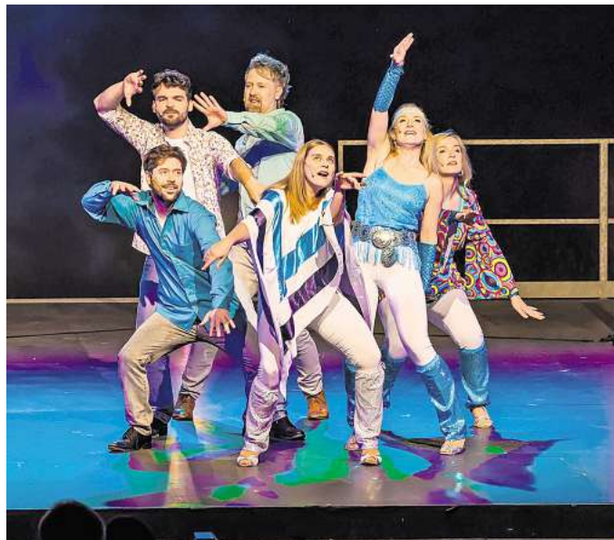
Diese sechs Sängerinnen und Sänger bringen die „Faszination Musical“ wieder auf die Bühne und zwar am Biedermeierstrand Hayna. Bemerkenswert dabei: Sie tun dies aus Liebe zur Musik, zum Tanz und zum Musical.

Und auch dies ist beeindruckend: Seit der Jahrhundertflut im Jahre 2002 gestaltet das Sextett musikalisch die Leisniger Benefizgala, die neben der Unterstützung der Flutbetroffenen damals und später im Jahr 2013 inzwischen vielen weiteren Vereinen und bedürftigen