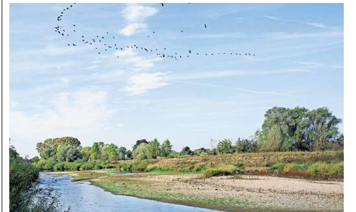
Durch die Mulde bei Bad Düben führt der Kohlhaas-Weg: Am 6. Juni geht es auf diesen in einer geführten Wanderung durch die Natur.