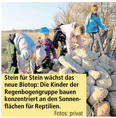
Stein für Stein wächst das neue Biotop: Die Kinder der Regenbogengruppe bauen konzentriert an den Sonnenflächen für Reptilien.