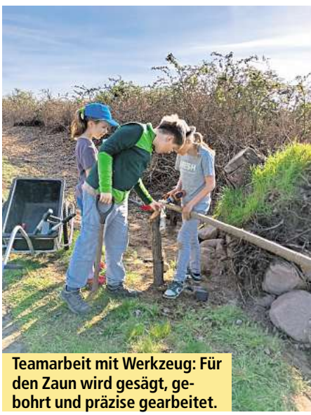
Teamarbeit mit Werkzeug: Für den Zaun wird gesägt, gebohrt und präzise gearbeitet.