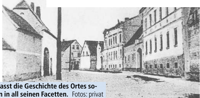
Die Pohritzscher Dorfchronik umfasst die Geschichte des Ortes sowie der um liegenden Ortschaften in all seinen Facetten.

alte Dokumente. Er sichtet Fotos, sammelte Erinnerungen und brachte zahllose Informationen zunächst mühsam auf Papier. „Das Ergebnis dieses außergewöhnlichen Engagements umfasst heute zwei umfangreiche Bände. Während Band 1 die allgemeinen geschichtlichen Entwicklungen dokumentiert, widmet sich Band 2 detailliert dem dörflichen Leben: Vereine, Handwerksbetriebe, Gewerbe, Persönlichkeiten und Traditionen werden dort eindrucksvoll beschrieben“, so Ina Bartels weiter.