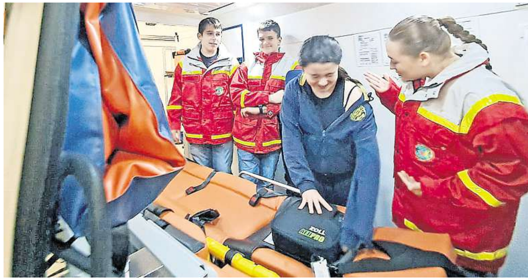
Kürzlich erhielten die Kinder und Jugendlichen des Delitzscher Jugendrotkreuzes Einblick in die Arbeit des Bevölkerungsschutzes.

Wer in Gemeinschaft mit anderen auch etwas Aufregendes erleben möchte, kann in die JRK-Gruppenstunde gern einmal hineinschnuppern. In der Regel treffen sich die Kinder und Jugendlichen immer jeden zweiten Montag im Monat von 16.30 bis 18 Uhr in der Eilenburger Straße 65 A (Hinterhaus) in Delitzsch. Gibt es Anfang des Jahres neben einem Elternabend