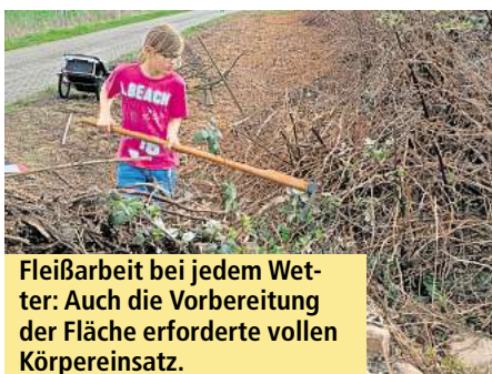
Fleißarbeit bei jedem Wetter: Auch die Vorbereitung der Fläche erforderte vollen Körpereinsatz.