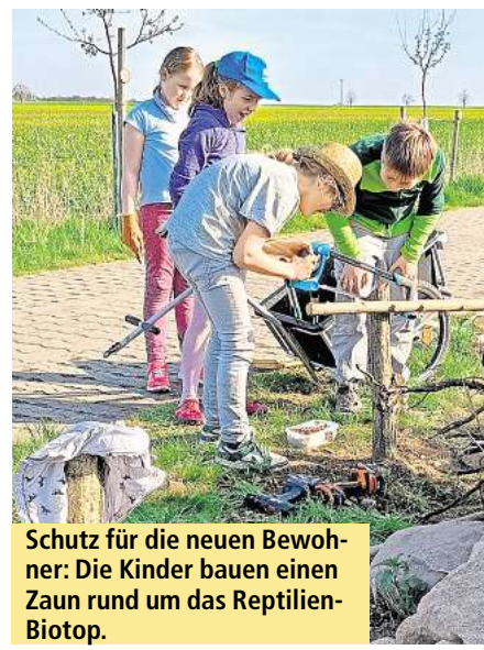
Schutz für die neuen Bewohner: Die Kinder bauen einen Zaun rund um das Reptilien-Biotop.

ideal an. „Hier ist immer Sonne.“ Wird es jedoch zu heiß oder droht Gefahr, dienen Sandflächen und Wurzeln als Versteck. „Ich bin stolz auf meine Gruppe. Sie hat fleißig und hart gearbeitet, sodass die Anlage Anfang Mai fertiggestellt werden konnte. Nun greifen wir nicht mehr ein, sondern beobachten gespannt, was sich im August und September hier entwickelt“, so Schmuck.