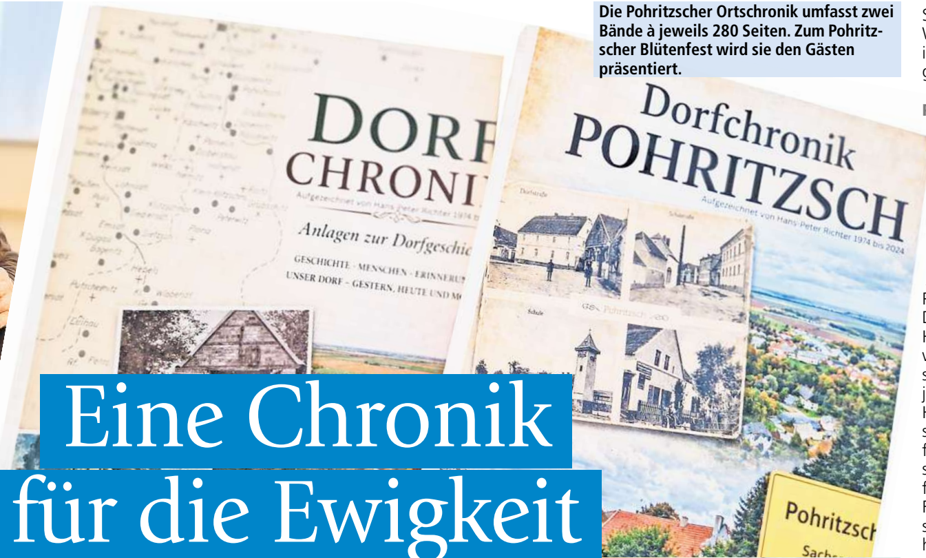
Die Pohritzscher Ortschronik umfasst zwei Bände à jeweils 280 Seiten. Zum Pohritzscher Blütenfest wird sie den Gästen präsentiert.