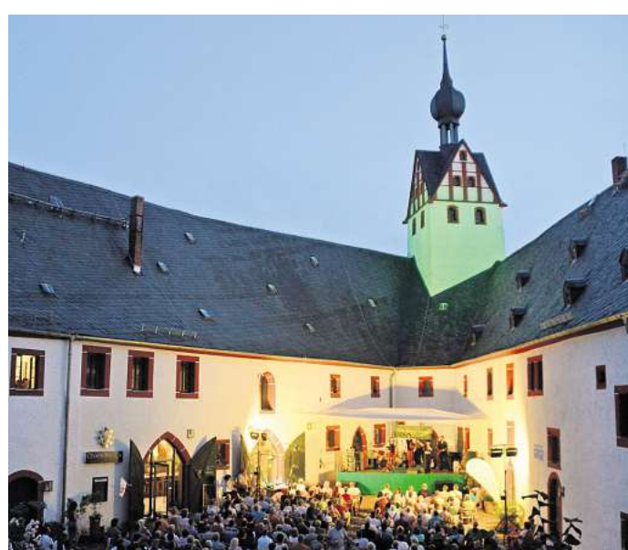
Die Rochsburg lädt zur Irischen Nacht.

Nähere Infos, Tickets und vollständige Übersicht der Vorverkaufsstellen: https://www.miskus.de/irische-nacht . Vorverkauf Normalpreis 20 Euro, Abendkasse Normalpreis 22 Euro