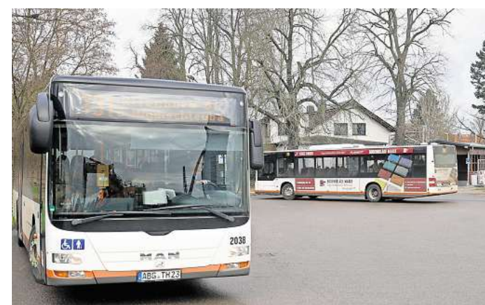
Den Bahnhof Regis-Breitungen steuern mehrere Buslinien an, um ein Umsteigen von der und zur S-Bahn zu ermöglichen. Die Linie 258 Borna – Lucka aber wird hier seit Ende 2025 unterbrochen.