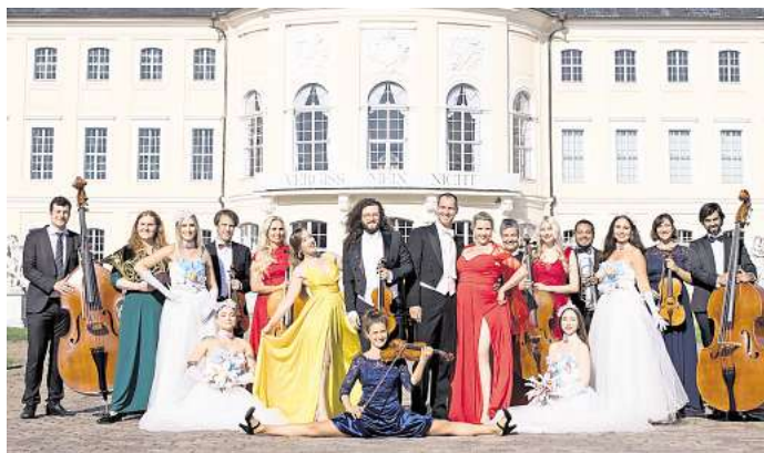
Die große Johann-Strauss-Revue ist im September in Eilenburg zu erleben.

Die Musiker des Wiener-Walzer-Orchesters, die weltweit be-