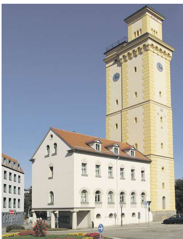
Der Kunstturm, Zeugnis der Wasserversorgung.

Der diesjährige „Tag des offenen Denkmals“ findet am Sonntag, 13. September statt. Er steht unter dem bundesweiten Motto: