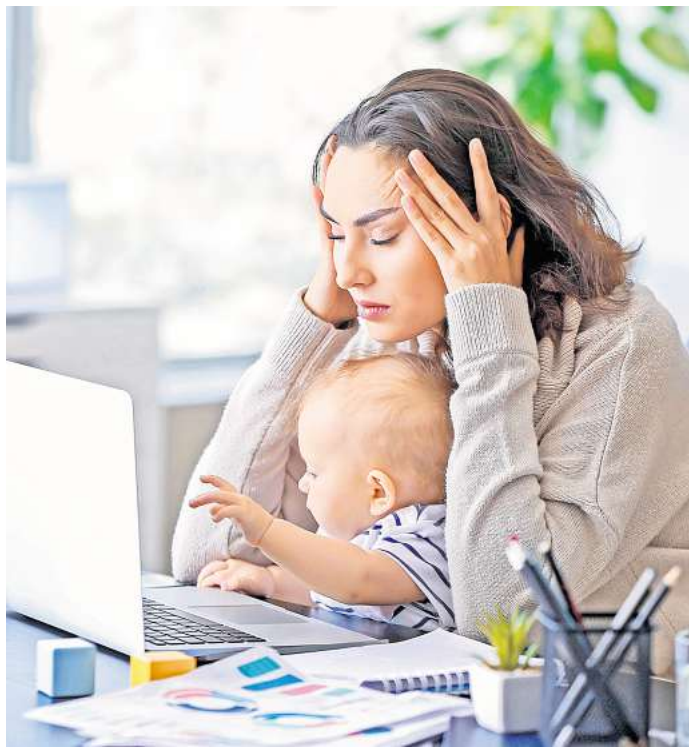
WENN IM STRESSIGEN ALLTAG die Kraft ausgeht, muss neue Energie her.

Das bringt den Kreislauf richtig auf Trab und verbessert die Sauerstoffversorgung. Energie von innen liefert zusätzlich eine gute Flüssigkeitszufuhr. Gerade bei Menschen, die unter Stress dazu neigen, das Trinken zu vergessen, kann ein Glas Wasser oder Fruchtschorle das Wohlbefinden schnell verbessern. Kaffee oder grüner Tee in Maßen können ebenfalls neuen Schwung geben.