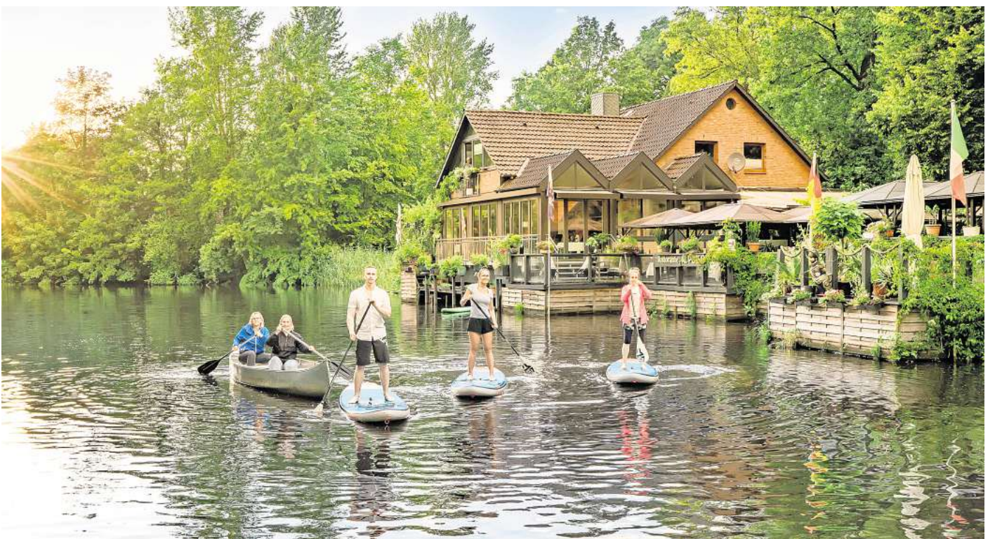
Neue Paddeltrails führen rings um Stades Altstadt und bis ins Tal der Schwinge im Alten Land.

Im Kanu oder auf dem Stand-up-Board gleiten Aktivurlauber fast lautlos durch die Landschaft und tauchen mit allen Sinnen in die Natur ein. In vielen Städten können sie vom Wasser aus neue Perspektiven entdecken. Die meisten Flüsse in Niedersachsen sind auch ohne Erfahrung leicht zu befahren, an den Ufern warten spannende Orte und Erlebnisse.