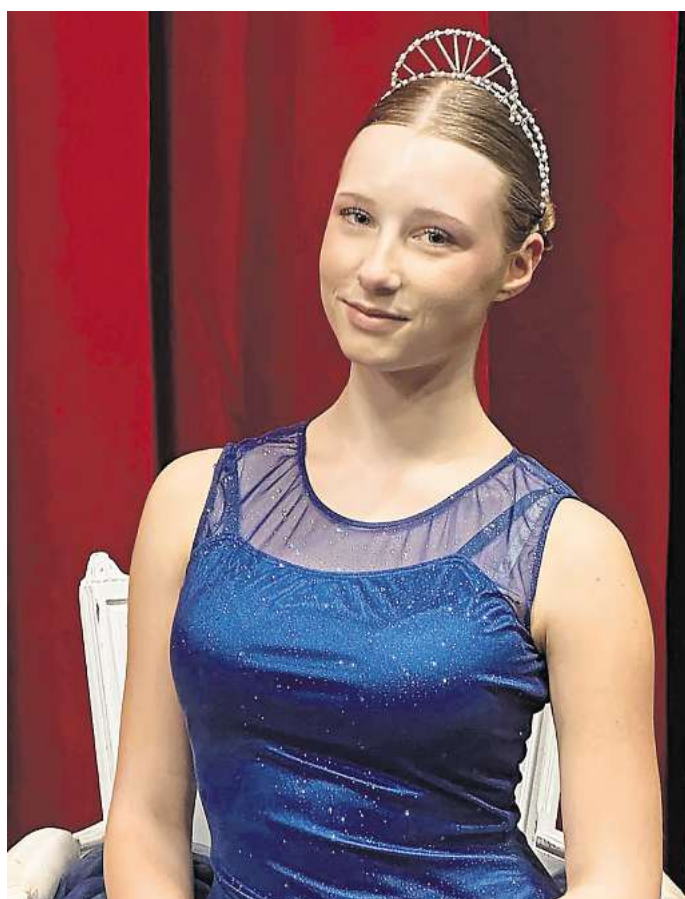
Das passende Kostüm darf beim Ballett nicht fehlen.