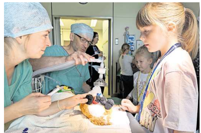
Das Teddy-Krankenhaus heißt alle Kinder mit Ihren Puppen und Teddys im Vorschulalter herzlich willkommen.

Nebenbei beantworten die Ärztinnen und Ärzte zahlreiche Fragen wie: „Wie hört sich ein Herzschlag an?“, „Wie sieht ein „Brutkasten“ für frühgeborene Babys aus?“, „Wie macht man einen Verband?“ und „Wie funktioniert Ultraschall?“. Die Kinder können bei jeder Be-