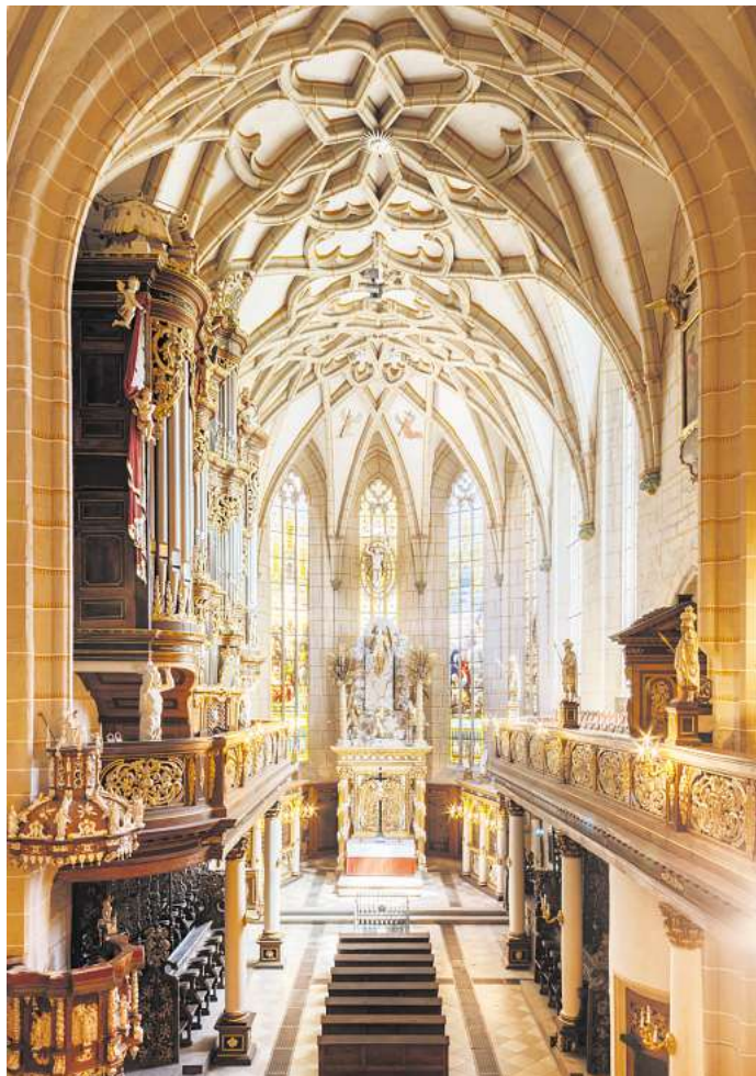
In der Schlosskirche des Residenzschlosses Altenburg finden am Sonntag gleich zwei hochkarätige Chorkonzerte statt.

Beim ersten Konzert des Tages trifft der Madrigalchor aus Dessau, der auf eine mittlerweile 100-jährige Tradition zurückblicken kann, auf den Aequalis-Frauenchor aus Gera. Während sich der Chor aus der Bauhaustadt Dessau auf die Aufführung von Liedgut aus dem 15. und 16. Jahrhundert spezialisiert hat, umfasst das Repertoire des Geraer Chores Musik vom 12. Jahrhundert bis in die heutige Zeit. Für die Besucherinnen und Besucher des Konzerts in der Schlosskirche des Residenzschlosses Altenburg bietet sich damit die Gelegenheit, ein ganz besonderes Konzertereignis zu