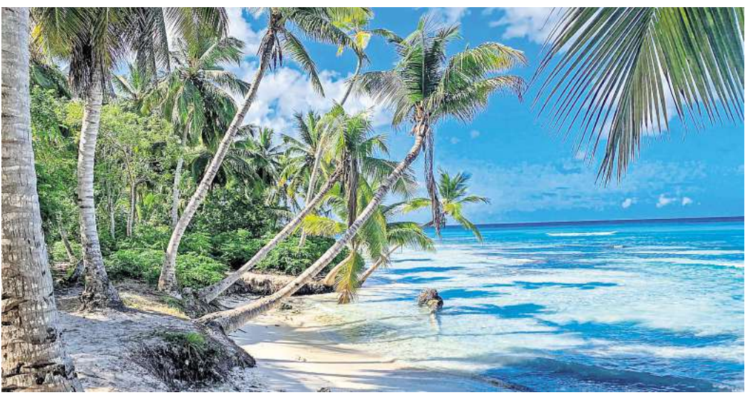
Palmen, Strand - ganz ohne Stress. Damit es auch vor Ort so bleibt: beim Buchen nicht nur auf den Preis schauen, sondern aufs Gesamtpaket.

So berichtete die Verbraucherzentrale Niedersachsen von einem Fall aus ihrer Beratung, bei dem ein Urlauber bei der Buchung nicht gesehen hatte, dass