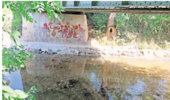
Die fertiggestellte Otterberme an der Pleißebrücke in Zschechwitz.

Um nicht unter den Brücken hindurchschwimmen zu müssen, klettern sie, sofern es keine Otterberme gibt, an den Straßenrand und überqueren die Fahrbahn, was für sie oft tödlich endet. Fischotter sind eine streng geschützte Art und genießen in ganz Europa den höchsten gesetzlichen Schutzstatus. Der Fachdienst Straßenbau- und Straßenverwaltung des Landkreises Altenburger Land begleitete und überwachte die umfangreiche Baumaßnahme, die rund 60.000 Euro kostete.