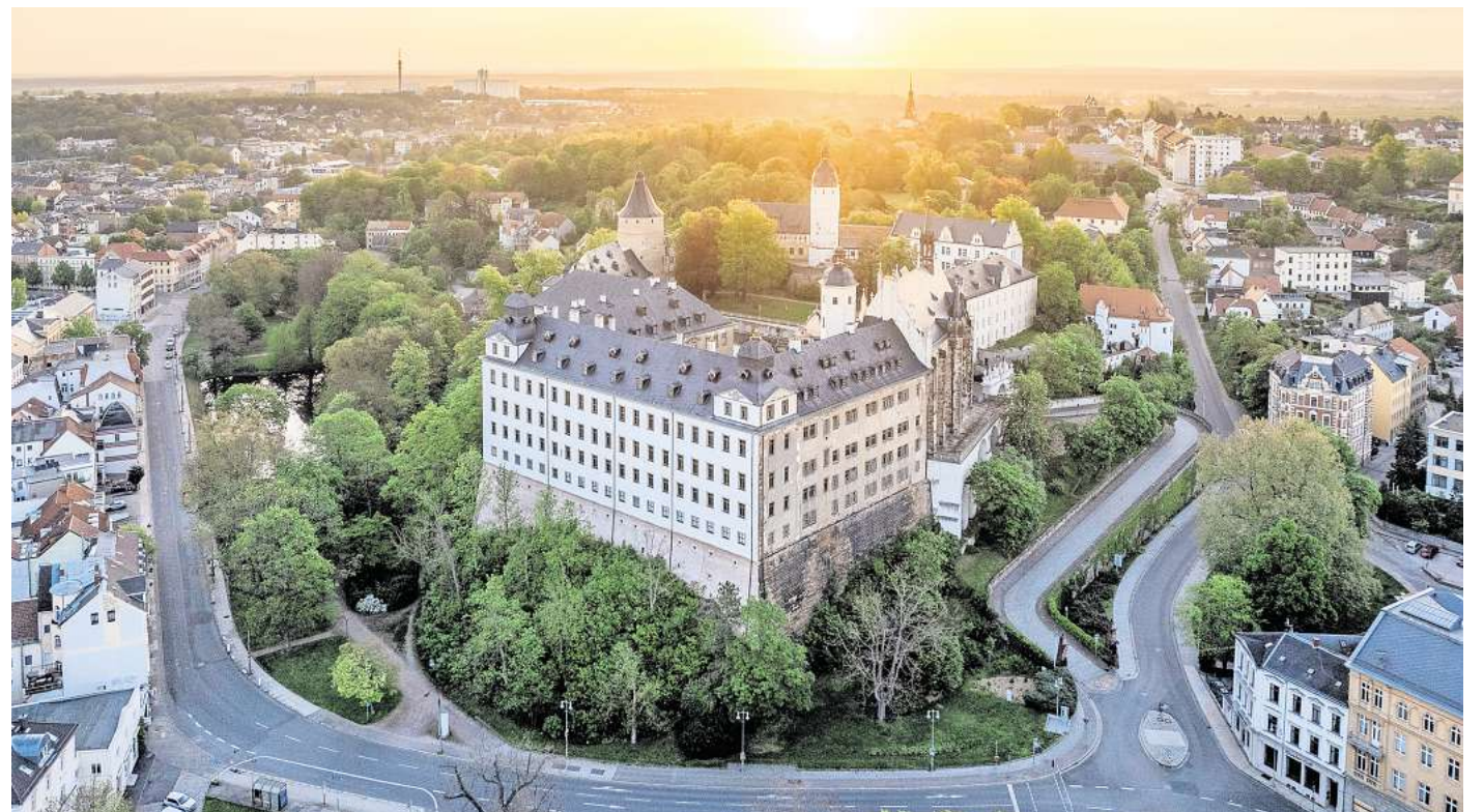
Das Residenzschloss Altenburg ist einer der großen Touristenmagneten des Altenburger Landes.

Für das Jahr 2026 verfolgt der TVAL gleich zwei zentrale Ziele: mehr Übernachtungen aus den Wachstumsmärkten Bayern, Hessen, Nordrhein-Westfalen, Baden-Württemberg sowie Berlin und Brandenburg sowie eine durchgängige Online-Buchbar-