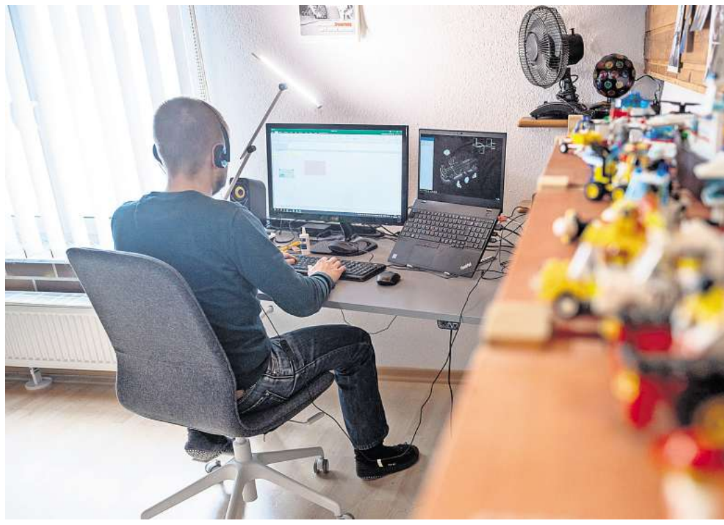
EIN EIGENER SCHREIBTISCH , Ruhe und ein ergonomischer Stuhl sind ein guter Anfang für einen gelungenen Homeoffice-Platz.

Der Stuhl sollte mindestens fünf Rollen haben und höhenverstellbar sein. Zwischen Ober- und Unterarmen sollte ein möglichst rechter Winkel bestehen, so dass die Arme unter Herzhöhe platziert werden. Die Hände sollten locker auf der Tastatur aufliegen. „Sind sie in einem spitzen Winkel nach oben gerichtet, kommt