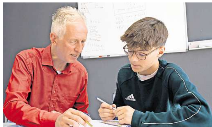
VIELE PENSIONIERTE LEHRKRÄFTE wollen nicht ganz aufhören, mit Kindern zu arbeiten. Eine Tätigkeit in der Nachhilfe ist eine gute Alternative zum früheren Vollzeitjob.

Der klassische Einstieg führt über ein Nachhilfeeinstitut vor Ort. Diese Tätigkeit eignet sich etwa für Studierende, pensionierte Lehrkräfte, aktive Seniorinnen und Senioren oder Eltern, die nach einer familiären Phase wieder ins Berufsleben einsteigen möchten. Feste Kurszeiten, der persönliche Kontakt zu den Schülerinnen und Schülern sowie die Arbeit in kleinen Lerngruppen sorgen für einen klar strukturierten Rahmen. Pädagogische Erfahrung ist von Vorteil, ein