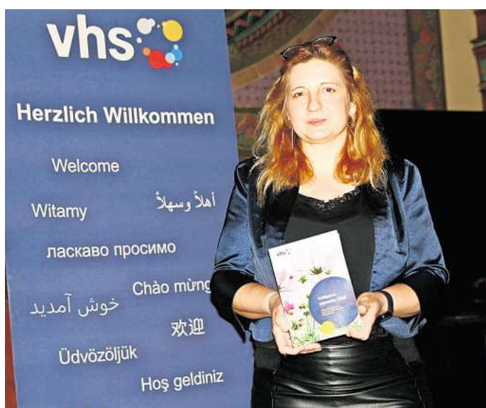
Das VHS-Programm ist auch in diesem Semester wieder prall gefüllt.