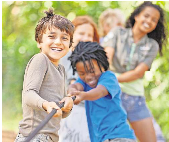
Im Grundschulalter sind Bewegungsspiele besonders wertvoll, weil sich jetzt die motorischen Fähigkeiten stark entwickeln.

Laufen, springen, spielen – und jeden Tag etwas Neues lernen. Dabei wachsen Kinder sehr schnell. Vor allem das Spielen ist unverzichtbar für eine gesunde Entwicklung.