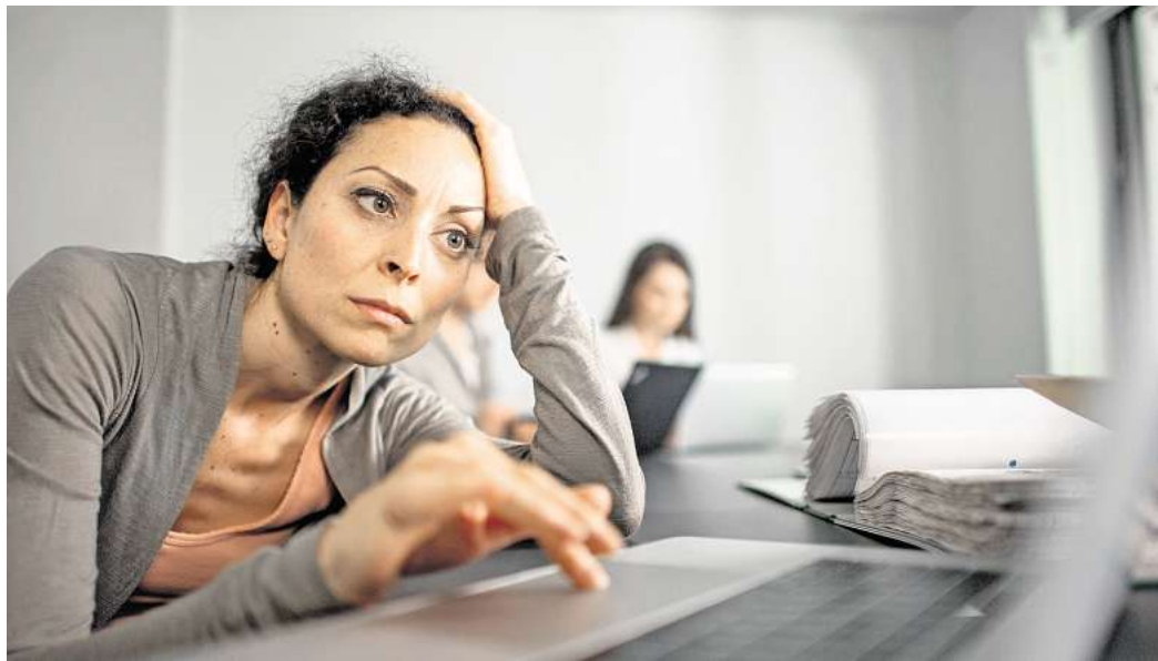
SIE BRAUCHEN NEUE MOTIVATION IM JOB? Dann können kleine Perspektivwechsel helfen, Prioritäten neu zu ordnen.