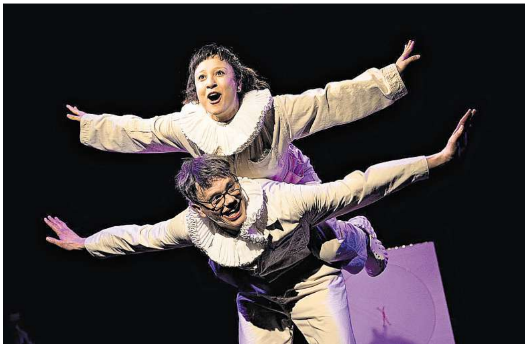
Bei „Schwäne“ vom Thalia Theater Halle dreht sich alles ums Anderssein und um das Zu-sich-selbst-Finden.

Bei „Schwäne“ vom Thalia Theater Halle dreht sich alles ums Anderssein und um das Zu-sich-selbst-Finden. Die Inszenierung wird zudem spielerisch von zwei Dolmetscherinnen in Gebärdensprache übertragen. Ums Außenseitertum, den Umgang mit Mobbing und den vielleicht schrecklichsten Camping-