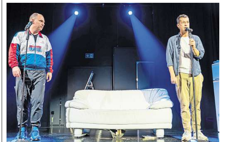
Die Herkuleskeule Dresden sorgt mit „Rabimmel, Rabammel, Rabumm“ im Theaterzelt Altenburg für Stimmung.

➔ Infos und Karten in den Theaterkassen, telefonisch unter 0365 8279105 (Gera) bzw. 03447 585160 (Altenburg) sowie online unter www.theater-altenburg-gera.de .