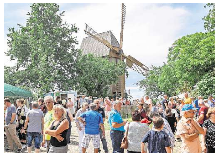
Auch in diesem Jahr wird es zum Deutschen Mühlentag an der Bockwindmühle in Lumpzig einiges los sein.

In der großen Mühlenscheune kann bei jedem Wetter gefeiert werden. Auf dem gesamten Gelände werden verschiedene regionale Manufakturen ihre Pro-