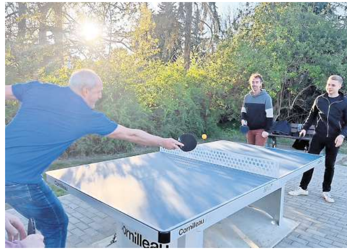
Die neue Tischtennisplatte in Kosma wurde natürlich gleich sportlich eingeweiht.

NEUE TISCHTENNISPLATTE in der Hauptstraße in Kosma erfreut sich großer Beliebtheit