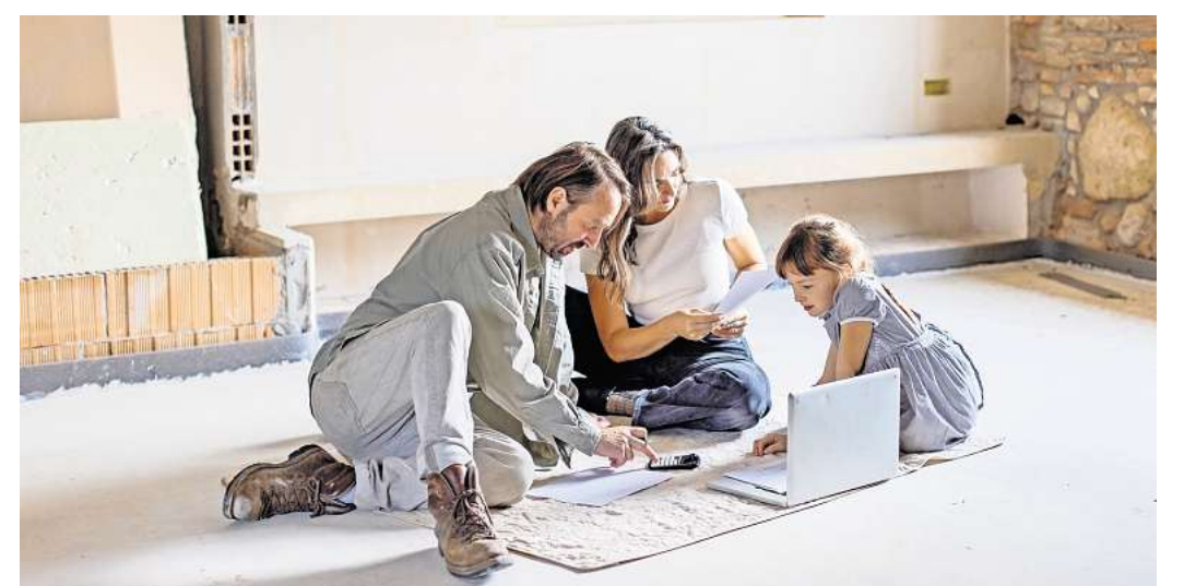
OHNE MOOS NIX LOS: Die Finanzierung eines Hausbaus sollte weitsichtig und nicht zu optimistisch geplant werden.

Nicht nur bei komplexen Finanzierungsfragen ist es sinnvoll, auf unabhängige Beratung zurückzugreifen. Der BSB etwa unterstützt Verbraucher mit fundierten Informationen und individueller Beratung rund um Hausbau und Finanzierungsplanung. Auf der Website www.bsb-ev.de finden Bauinteressierte weiterführende Informationen, Checklisten und Orientierungshilfen für eine sichere Baufinanzierung sowie die Adressen von unabhängigen Bauherrenberatern in ganz Deutschland. Wer sich frühzeitig informiert und professionellen Rat einholt, kann Risiken deutlich reduzieren und die eigene Finanzierung auf ein solides Fundament stellen.