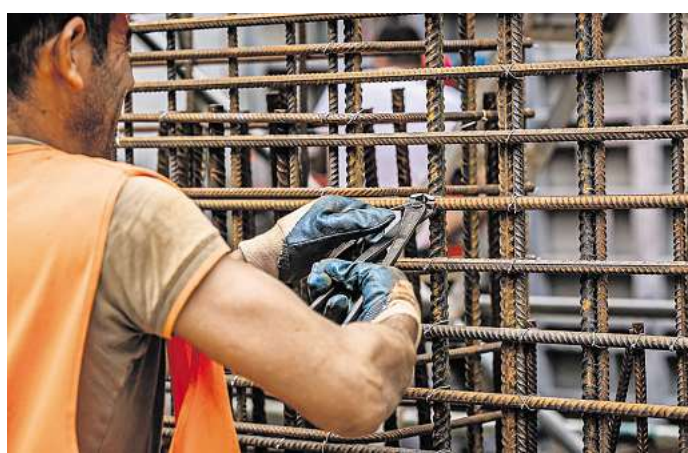
AUF DEM BAU LOCKEN BESSERE LÖHNE: Facharbeiter wie Beton- oder Straßenbauer im Landkreis Altenburger Land verdienen jetzt 26,05 Euro pro Stunde – und damit genauso viel wie ihre Kollegen im Westen. Darauf hat die IG BAU Thüringen hingewiesen.

Altenburger Land: Rund 850 BAU-BESCHÄFTIGTE arbeiten in 83 Betrieben