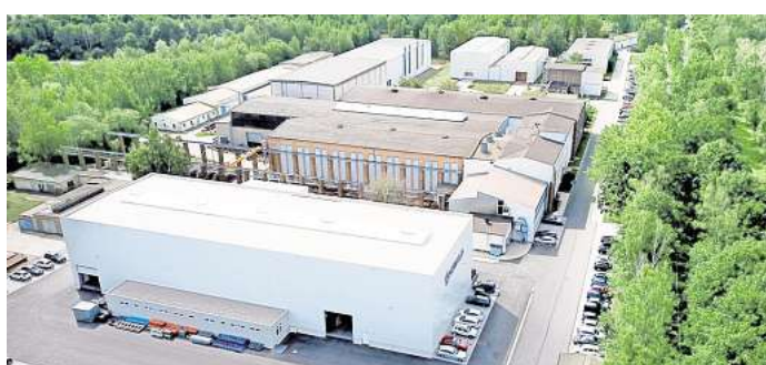
Das Sommerfest am 27. Juni bietet einen Blick hinter die Kulissen der Maschinenfabrik Herkules Meuselwitz.

MEUSELWITZ. Am 27. Juni öffnet die Maschinenfabrik Herkules Meuselwitz ab 10 Uhr ihre Türen und lädt herzlich zum großen Sommerfest ein.